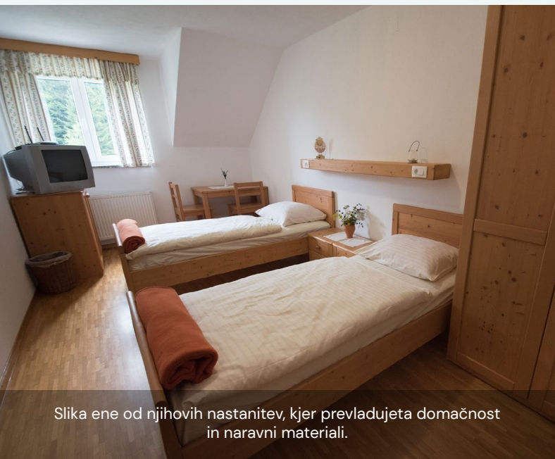
Slika ene od njihovih nastanitvev, kjer prevladujeta domačnost in naravni materiali.

Največja turistična sezona je v treh poletnih mesecih (junij, julij in avgust); takrat so popolnoma zasedeni. Zaprejo se izven sezone, tj. spomladi (april, maj) po zimski sezoni in jeseni po poletni sezoni (od septembra do začetka decembra).