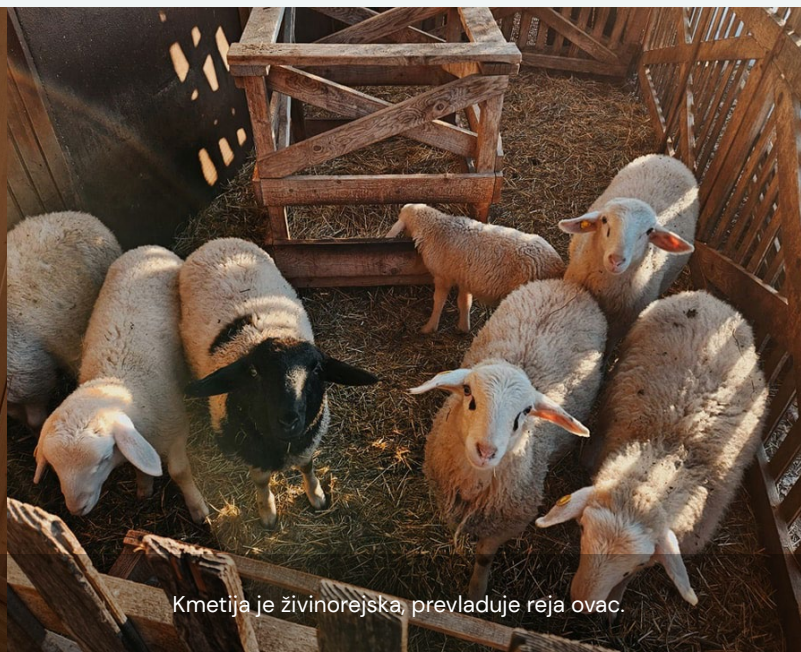
Kmetija je živinorejska, prevladuje reja ovac.