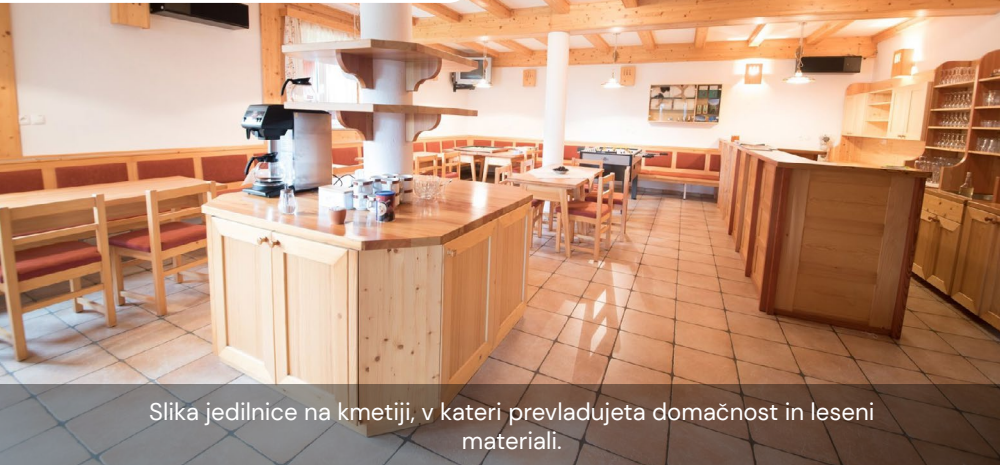
Slika jedilnice na kmetiji, v kateri prevladujeta domačnost in leseni materiali.