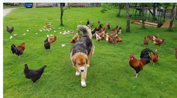
Živali na njihovi kmetiji.

Skozi leta so na Šenkovi domačiji nastanili več domačih turistov, v zadnjem času pa se je domet razširil tudi na tujce, ki so še posebej navdušeni nad njihovo ponudbo kampov. Njihova zasedenost se spreminja glede na sezono. Domači turisti veliko pogosteje obiskujejo v zimskih mesecih in manj v poletnih mesecih visoke sezone, medtem ko tujci obiskujejo predvsem julija in avgusta.