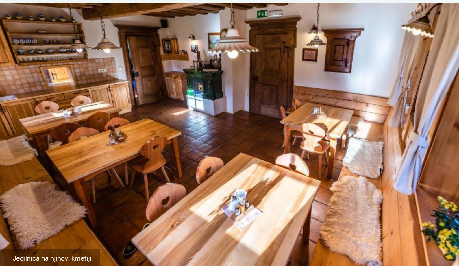
Jedilnica na njihovi kmetiji.

V delo na kmetiji ne vključujejo turistov, saj bi jim to pomenilo dodatno delo.