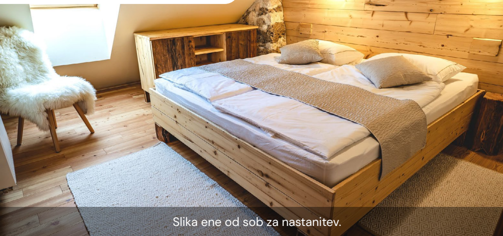
Slika ene od sob za nastanitev.