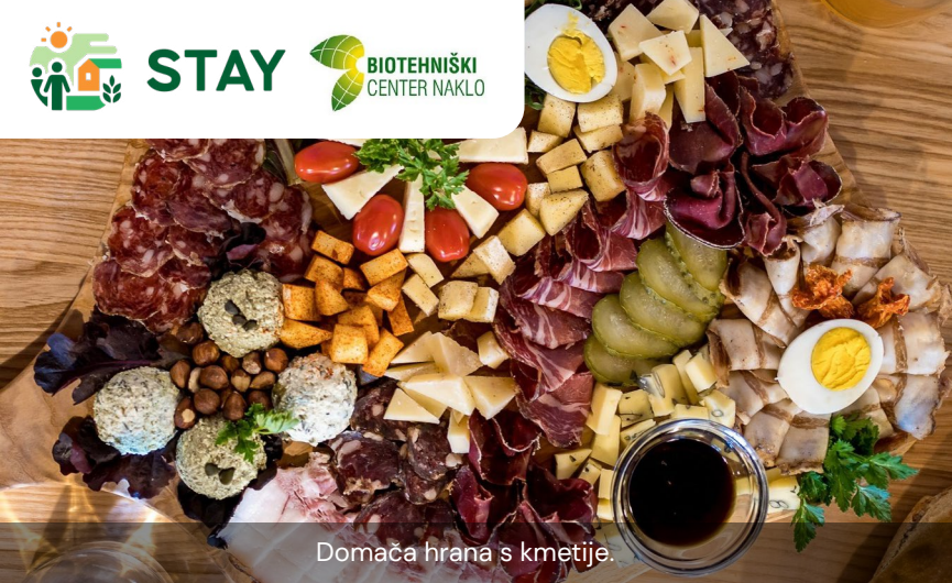
Domača hrana s kmetije.