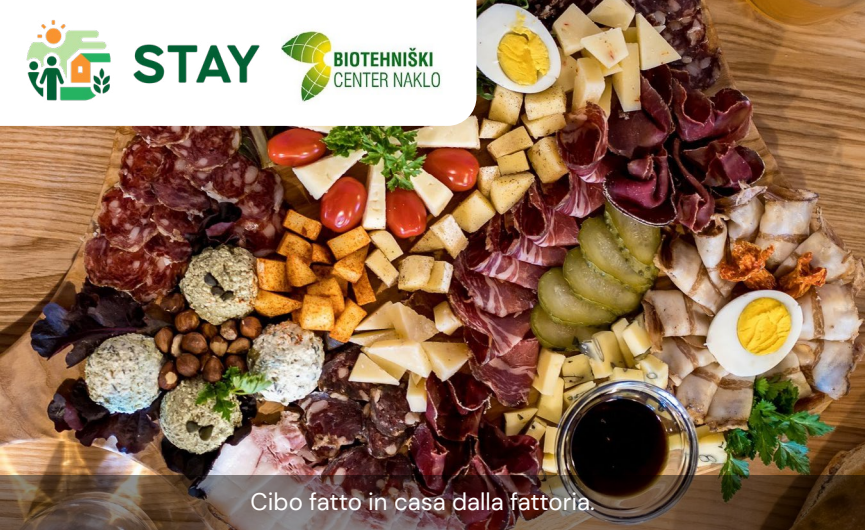
Cibo fatto in casa dalla fattoria.