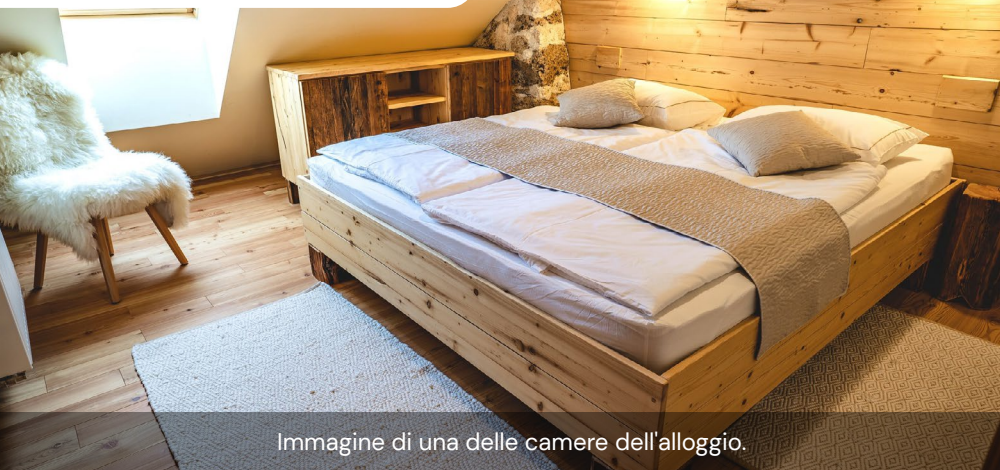
Immagine di una delle camere dell'alloggio.