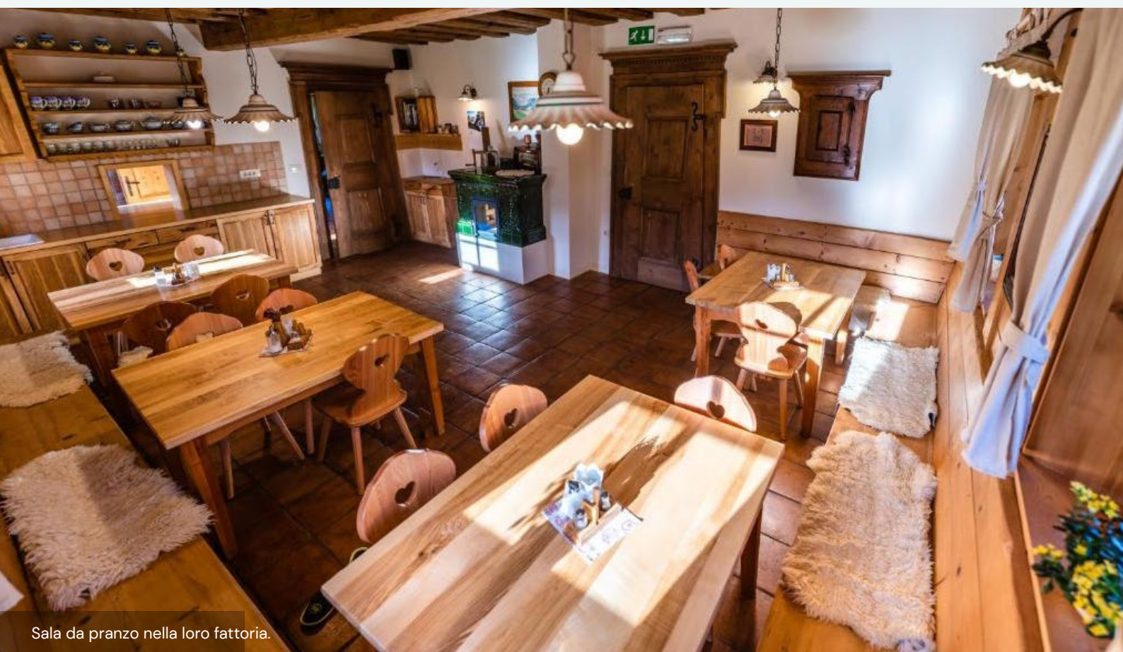
Sala da pranzo nella loro fattoria.

Non coinvolgono i turisti nel lavoro della fattoria, perché ciò significherebbe per loro un lavoro supplementare.