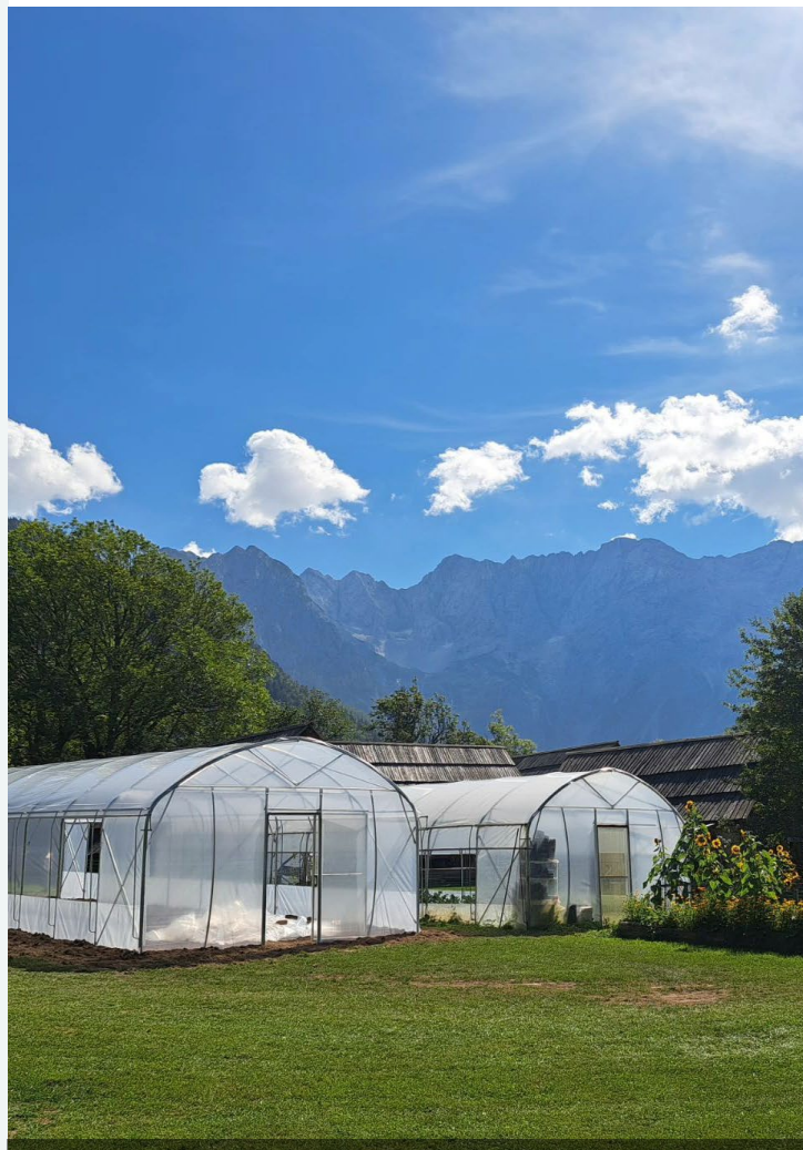
L'azienda agricola coltiva cibo tutto l'anno nella propria serra.

Le nostre aspettative per il futuro sono molto positive, vista la situazione e le prestazioni attuali.