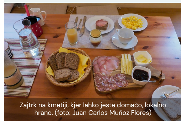
Zajtrk na kmetiji, kjer lahko jeste domačo, lokalno hrano.

Vodja kmetije je izrazil skrb glede trženja njihovih izdelkov in ponudbe, saj je na trgu velika konkurenca in je brez ustreznega trženja zelo malo verjetno, da bodo preživel.