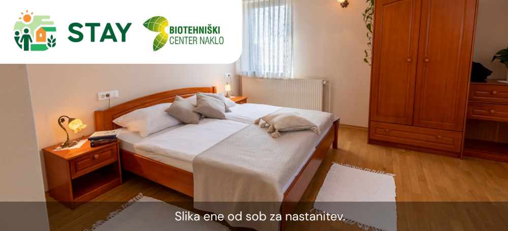
Slika ene od sob za nastanitev.