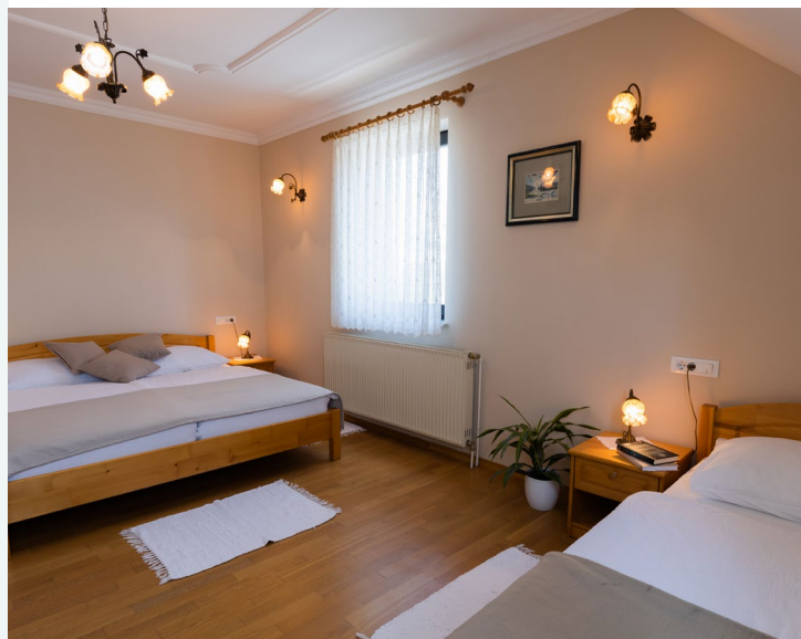
Slika ene od sob za nastanitev.

V bližnji prihodnosti želita dokončati svoj cilj preoblikovanja podjetja in začeti poslovati na ravni, ki sta si jo zastavila. Na kmetijskem področju želita povečati obseg proizvodnje z razpisi in po potrebi vzpostaviti predelovalne obrate v večjem obsegu.