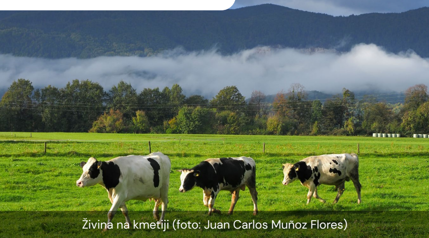
Živina na kmetiji