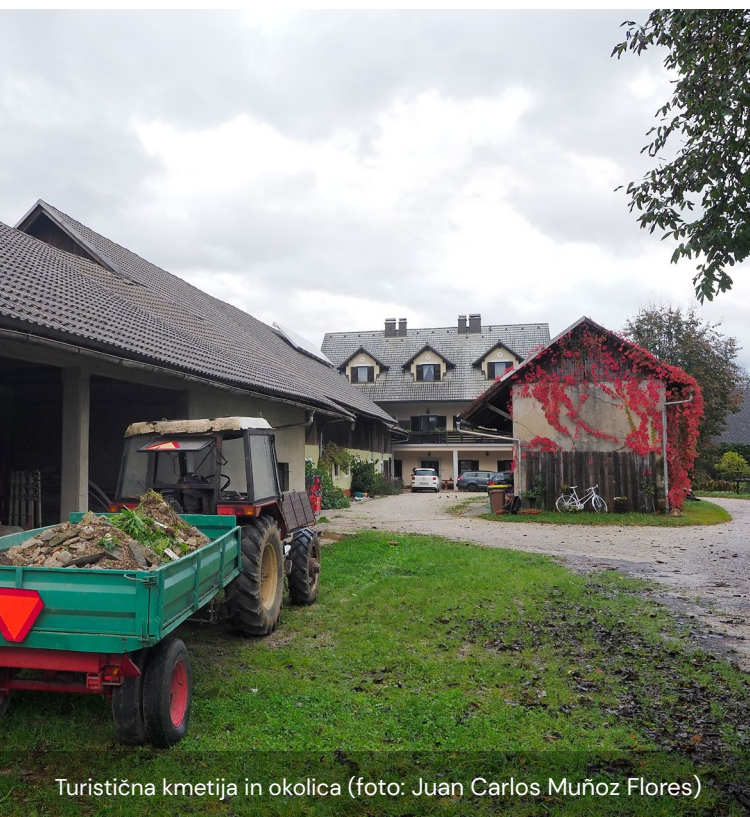
Turistična kmetija in okolica

Turisti ne sodelujejo pri kmečkih opravilih, saj bi jim to vzelo preveč časa. Bojijo se, da bi imeli na koncu več dela s turisti kot s samim delom.