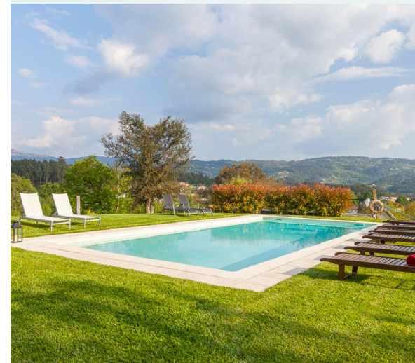
Območje bazena

Tukaj proizvedeni regionalni proizvodi, kot so različne vrste marmelade, borovničev liker, vinho verde (zeleno vino) ter sadje in zelenjava z ekološke kmetije, so namenjeni samo za prodajo obiskovalcem. Menijo, da ta razpoložljivost regionalnih proizvodov za nakup izboljša splošno izkušnjo gostov, saj jim omogoča, da okus edinstvene ponudbe Quinta do Olival prinesejo domov.