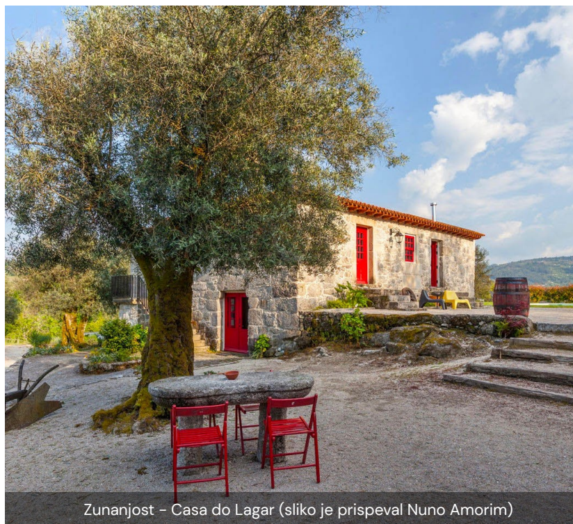
Zunanost – Casa do Lagar

Quinta do Olival se nahaja v občini Arcos de Valdevez v osrčju regije Alto Minho. Ta regija s čudovito naravno in pastirsko pokrajino, zelenimi griči, ki jih brazdajo čiste vode, bogato in raznoliko gastronomijo ter regionalnim vinho verde so privilegiji, v katerih lahko uživajo obiskovalci. Na območju so na voljo tudi sprehodi, kolesarjenje in vodne dejavnosti, kot sta rafting in kanjonng.