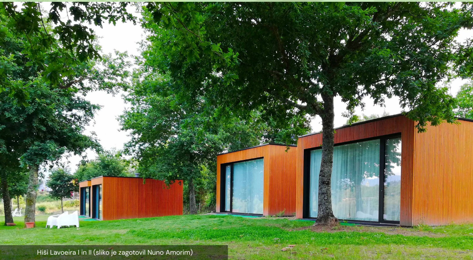
Hiši Lavoeira I in II

"Glavni nasvet, ki ga lahko ponudimo, je preprost in objektivni: delajte z ljubeznijo, predanostjo in zavzetostjo ter si prizadevajte za nenehno izboljševanje storitev, ki jih zagotavljamo." – Lastnik Nuno Amorim