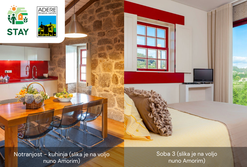
Notranjost – kuhinja