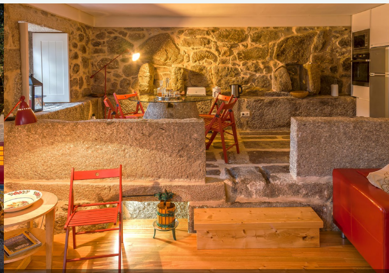
Notranost – Casa do Lagar