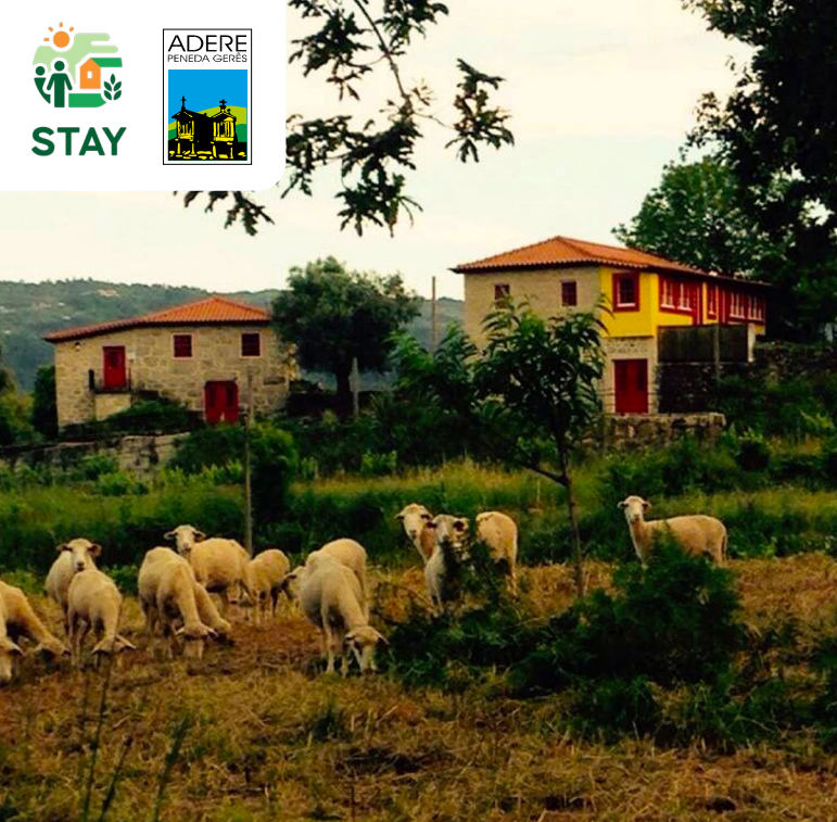
Živina – ovce