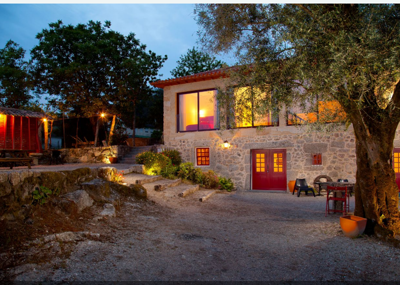
Zunanost – noč

Gostje lahko uživajo v sadovih sadovnjakov in v mirni pokrajini regije Alto Minho. Gostje se lahko pridružijo tudi pri delu na kmetiji, kot so skrb za ekološki zelenjavni vrt, nabiranje borovnic ali obiranje grozdja.