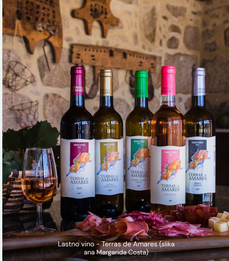
Lastno vino – Terras de Amares

Agroturistična podjetja na Portugalskem sestavljata dve ločeni dejavnosti/sectorja, in sicer turizem in kmetijstvo. Tako sta v tem obratu delujoči dve podjetji: kmečki turizem (Casa Lata) in proizvodnja vina (Terradamares – Sociedade de Vinhos Lda). Obe dejavnosti predstavljata več kot 75 odstotkov dohodka družine.