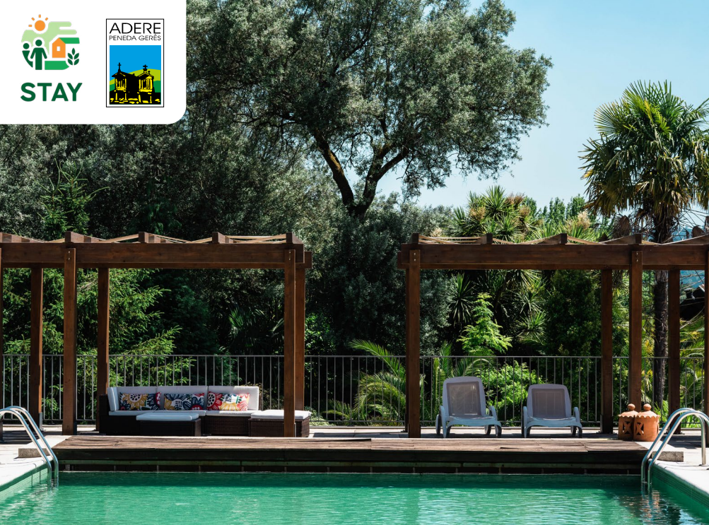
Prostor za prosti čas ob bazenu