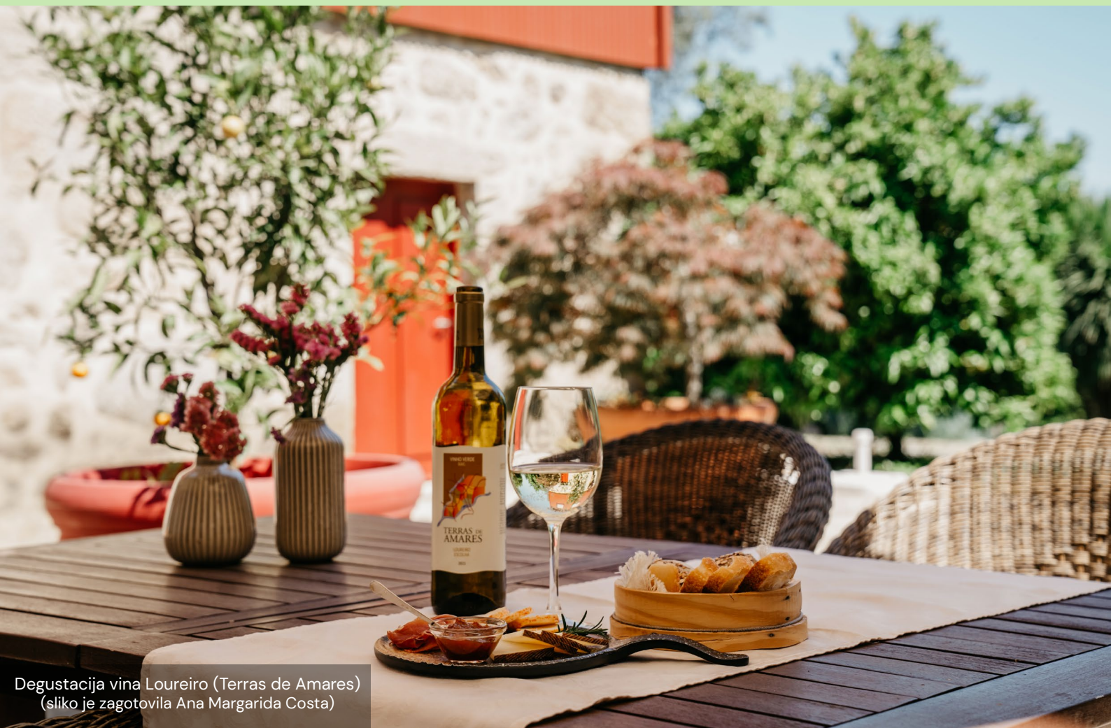
Degustacija vina Loureiro (Terras de Amares)

V prihodnosti družina predvideva strateško širitev vinskega turizma, zlasti zunaj sezone. Ta napredni pristop je skladen s širšim trendom v panogi, saj izkorišča potencial za letošnje sodelovanje in omogoča, da je podjetje namenjeno različnim obiskovalcem.