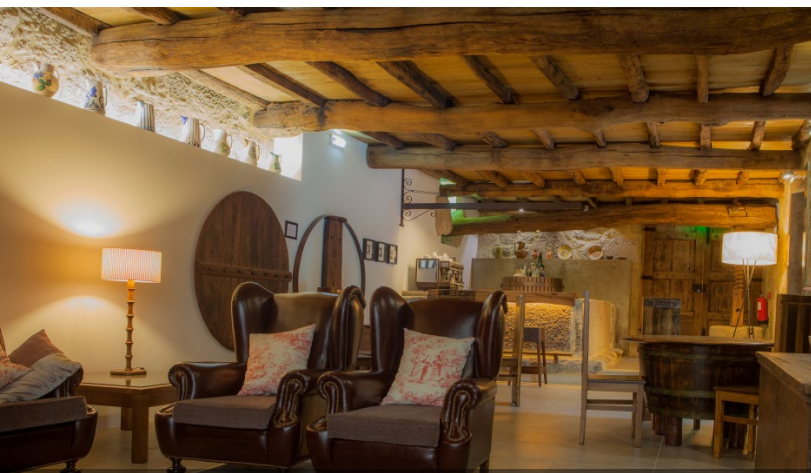
Dnevna soba – stara vinska klet

Trenutno nimajo posebnega programa za trgatev, vendar lahko gostje spremljajo prihod grozdja v vinsko klet in se seznanijo s celotnim postopkom, dokler se grozdje ne spremeni v vino.