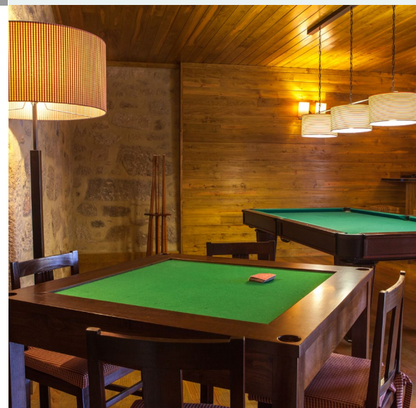
Igralna soba