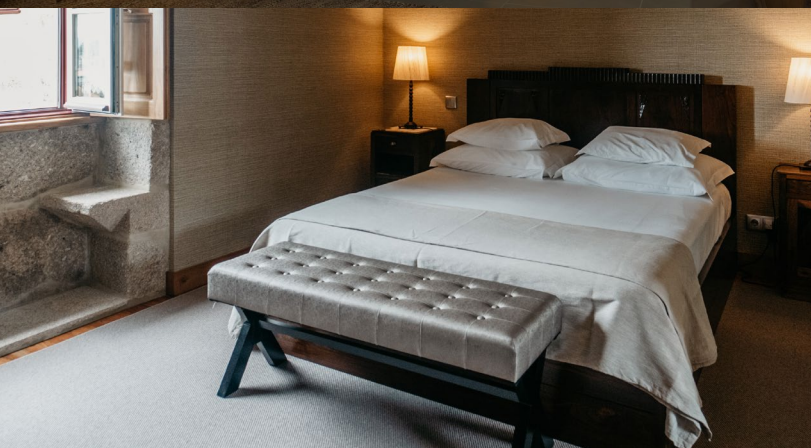
Klasična dvoposteljna soba 2