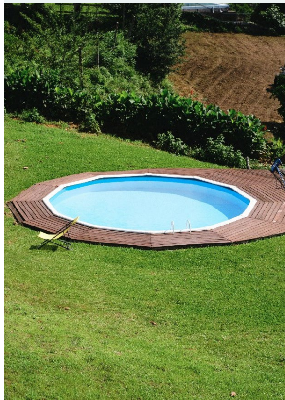
Prostor za prosti čas

Vino prodajajo samo v prostorih za turiste in domačine.