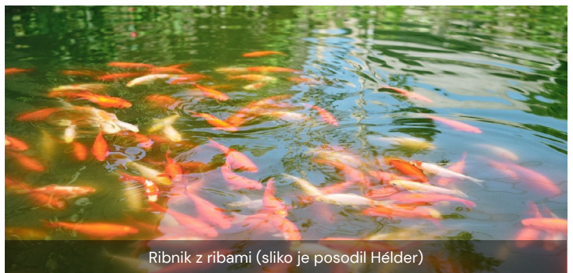
Ribnik z ribami

Kmetija Quinta da Mata se nahaja v podeželski lepoti vasi S. Martinho v občini Ponte da Barca v okrožju Viana do Castelo, na 5 hektarjih, s privilegiranim razgledom na gore in naravno pokrajino. Kmetija se nahaja na pobočju, ki ponuja prijeten razgled na dolino reke Vade. Blizu nacionalnega parka Peneda-Gerês je osrednja točka za obisk glavnih mest in krajev severne regije in regije Alto Minho, kot so Viana do Castelo, Braga in Porto.