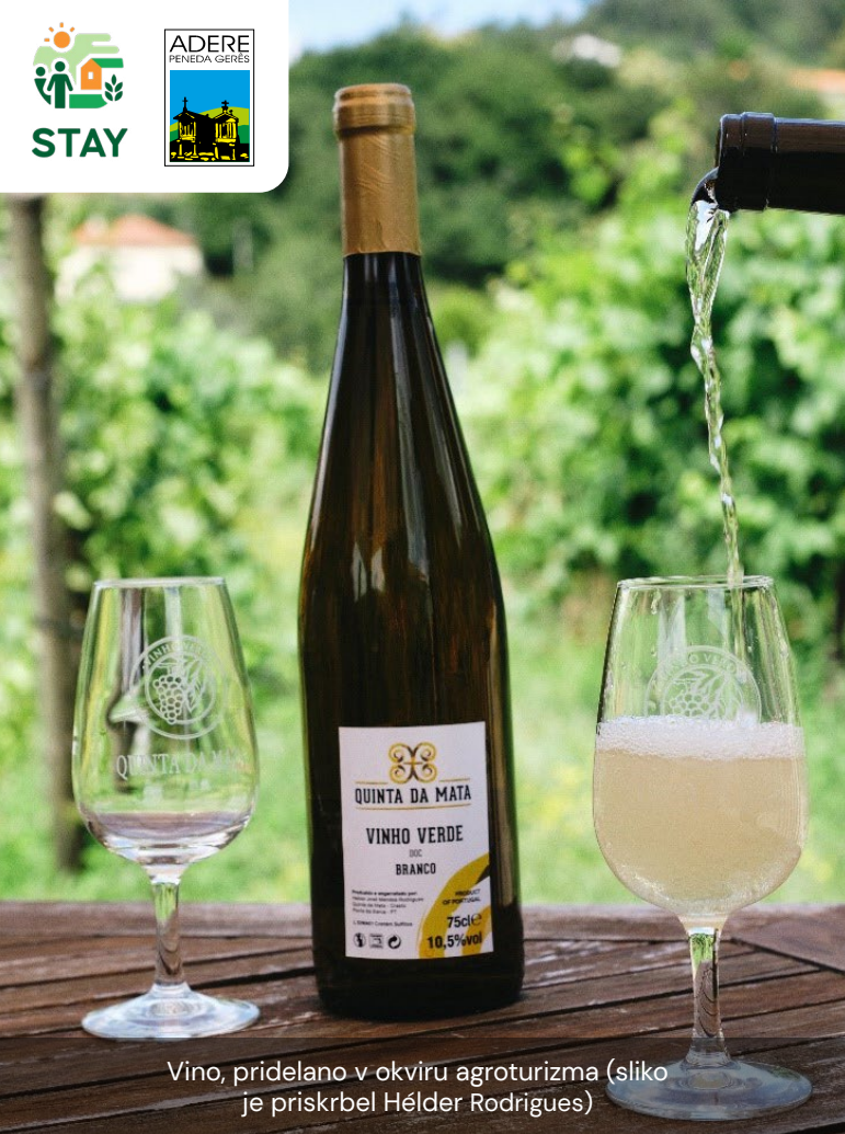
Vino, pridelano v okviru agroturizma

Te pobude odražajo zavezanost k nenehnim izboljšavam in proaktivnemu pristopu k izpolnjevanju zahtev razvijajočega se turističnega okolja. Ker so se jim zdeli postopki preveč birokratski, so se za izvajanje dejavnosti obrnili na svetovalno podjetje, ki jim je omogočilo prijavo za evropska sredstva prek programa PRODERE (program razvoja podeželja), ki ga financira Evropski kmetijski sklad za razvoj podeželja (EKSRP), kar je omogočilo boljši začetek. Finančna sredstva (50 % stroškov) so prejeli med letoma 2013 in 2015.