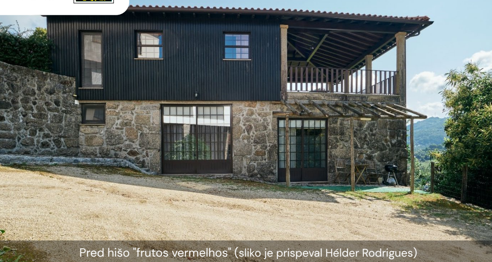
Pred hišo "frutos vermelhos"