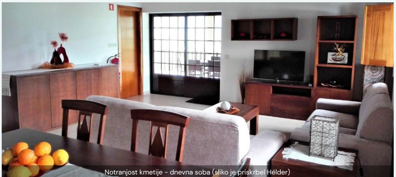
Notranjost kmetije – dnevna soba

Njihove stranke so predvsem družine med šolskimi počitnicami, stare od 30 do 45 let, z otroki, starimi od 2 do 15 let. Za preostali del leta nimajo ustaljenega profila.