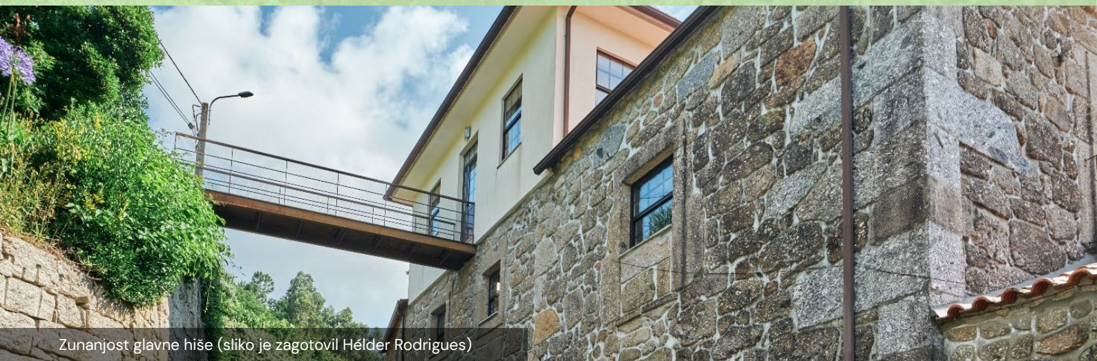
Zunanost glavne hiše

"Vedno bodite z nogami na tleh, vendar imejte pred očmi prihodnost in cilj nenehnega izboljševanja, bodisi z usposabljanjem bodisi s prihodnjimi naložbami." – Lastnik Hélder