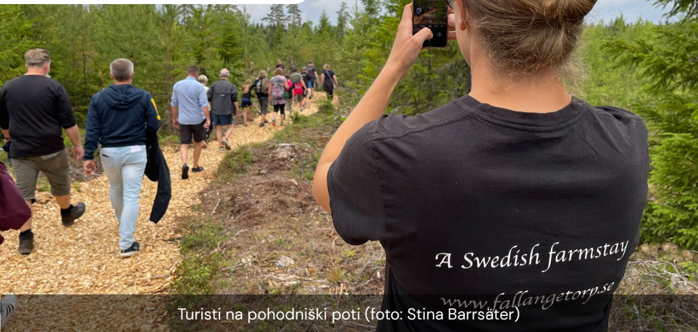
Turisti na pohodniški poti