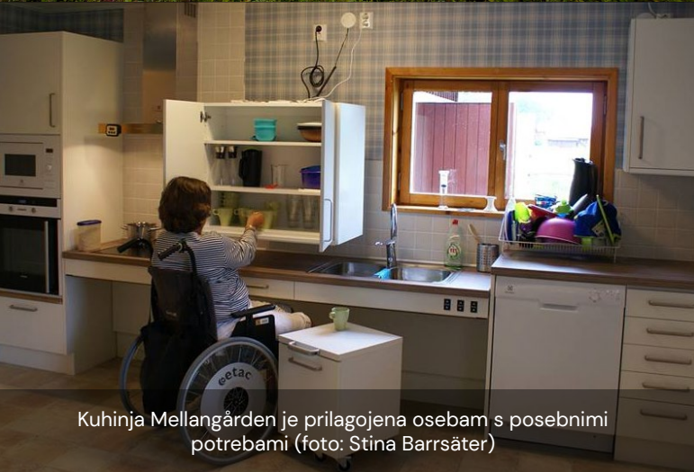
Kuhinja Mellangården je prilagojena osebam s posebnimi potrebami

Drugi glavni razlog, ki jih je spodbudil, da so se lotili tega podviga, je bila želja, da bi ljudi poučili o resničnosti dela v kmetijstvu in vsakdanjem življenju kmetov na Švedskem. Prav tako sta želela predstaviti življenje brez stresa, mir, naravo in dobro počutje na podeželju.