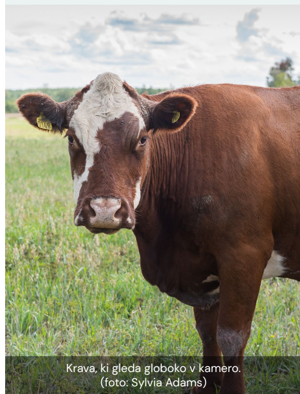
Krava, ki gleda globoko v kamero.

Kmetija trenutno nima nobenega fizičnega oglaševalskega gradiva, kot so letaki ali katalogi. Pred nekaj leti so imeli en letak v švedščini, vendar so ga prenehali tiskati in uporabljati.