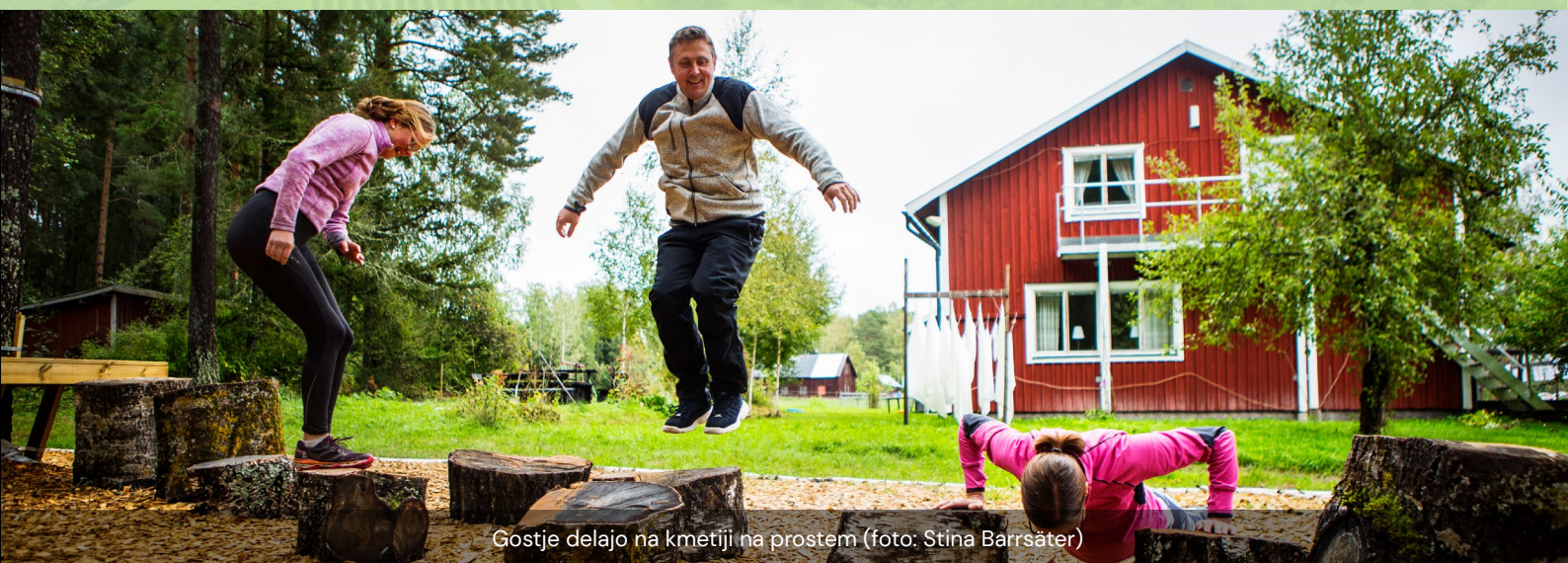
Gostje delajo na kmetiji na prostem

Drugi nasvet bi se lahko glasil: pogledjte, kaj imate in kaj lahko s tem naredite. Pot je sestavljena iz majhnih korakov. Začnete lahko tako, da enkrat na leto odprete svojo kmetijo za javnost in postopoma razvijate svojo dejavnost. Pametno izkoristite sredstva, ki jih imate, saj se včasih ne zavedamo, kakšen gospodarski potencial že imamo na voljo."