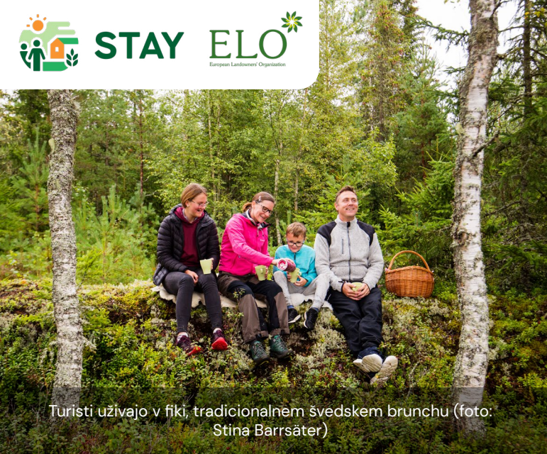
Turisti uživajo v fiki, tradicionalnem švedskem brunchu