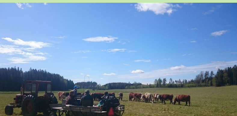
Dejavnost "Bodi kmet za en dan" s traktorjem in vozom za osebe z gibalnimi ovirami

Na kmetiji je trgovina, v kateri prodajajo meso, ki ga pridelajo iz svojih živali. Pri tem sodelujejo z drugimi proizvajalci, ki jim pomagajo pri predelavi mesa in izdelavi izdelkov, kot so burgerji ali klobase. Večjim podjetjem prodajajo tudi les in žito.