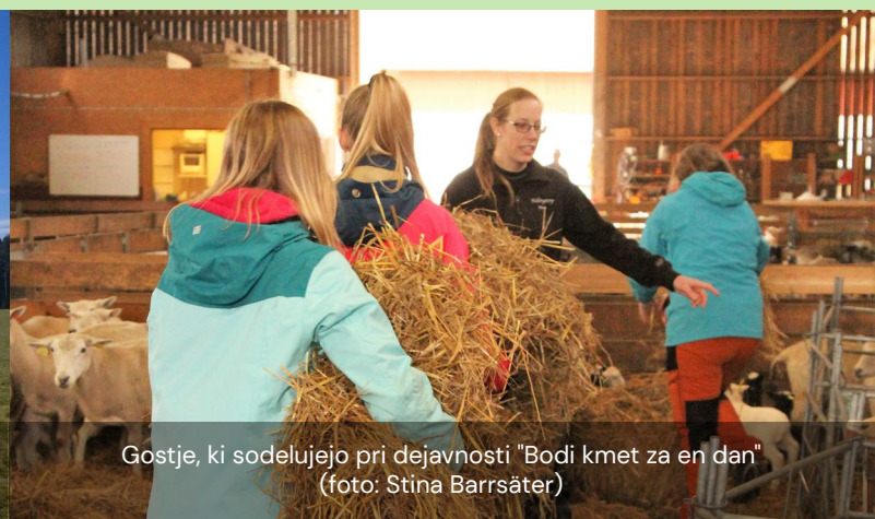
Gostje, ki sodelujejo pri dejavnosti "Bodi kmet za en dan"