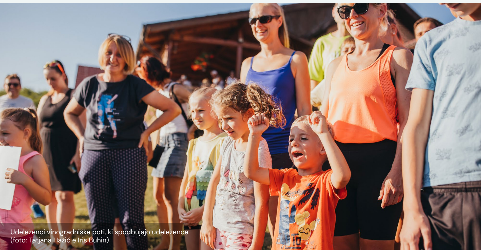
Udeleženci vinogradniške poti, ki spodbujajo udeležence.

Svojim strankam nudijo tudi brezplačne nasvete o kolesarskih in peš poteh po okolici.