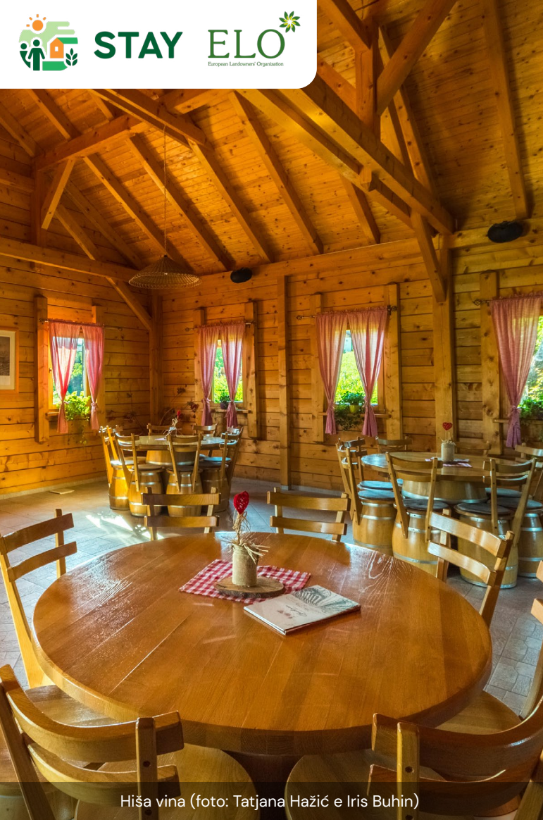
Hiša vina

V zadnjih nekaj letih so okoli termalnega zdravilišča in v njegovi bližini zgradili nove nastanitvene objekte, kar je na kmetijo pripeljalo nove stranke. Družina si je zamislila, da bi kmetijo razlikovala tako, da ne bi promovirala le izdelkov, ki jih sama proizvaja, temveč tudi naravno okolje, ki jih obdaja, in ponudila vrsto dejavnosti, ki so spoštljivo vpete v naravo. Takrat so se odločili, da bodo ponudili nastanitev, najprej s kampom, pozneje pa z gradnjo mobilnih hišic.