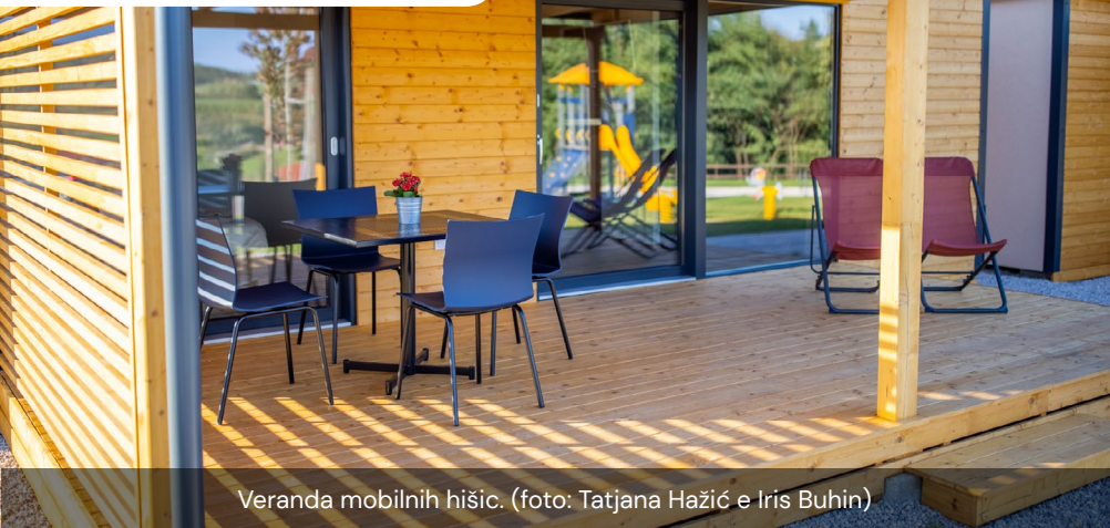
Veranda mobilnih hišic.