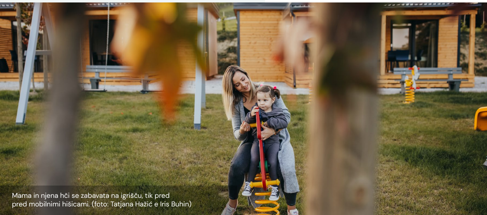
Mama in njena hči se zabavata na igrišču, tik pred pred mobilnimi hišicami.