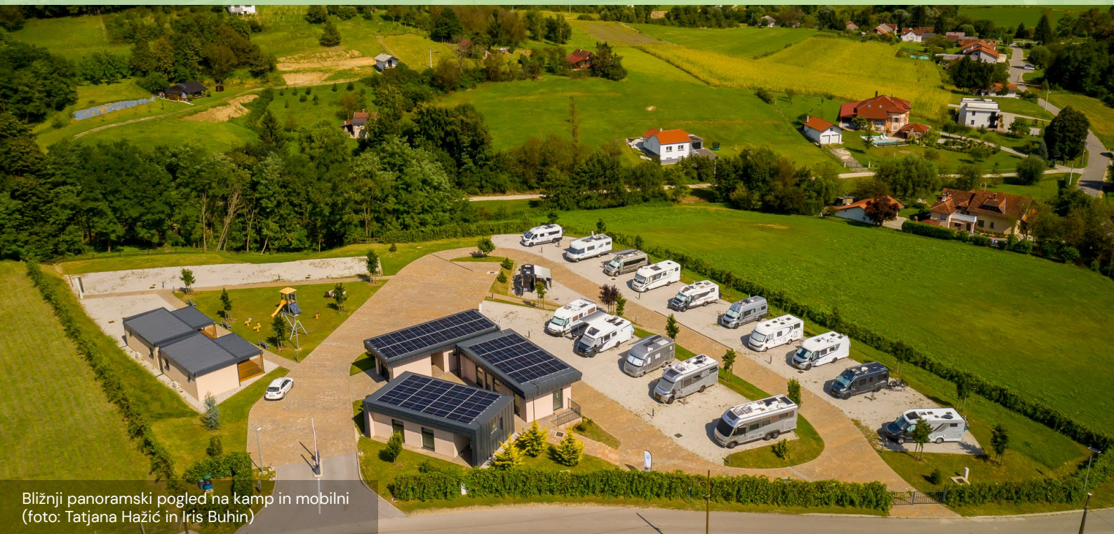
Bližnji panoramski pogled na kamp in mobilni

"Najpomembnejši nasvet, ki ga lahko damo vsakomur, ki razmišlja o vključitvi v sektor agroturizma, je delo, delo in delo. Trdo delo bo sčasoma obrodilo sadove. Gospod Hažič dela na kmetiji že več kot trideset let in vztraja, da morajo novinci pustiti strahove in dvome za seboj ter biti močni. Ne obupajte, saj ni lahko in zahteva veliko energije, vendar ste edini odgovorni za svoj uspeh."