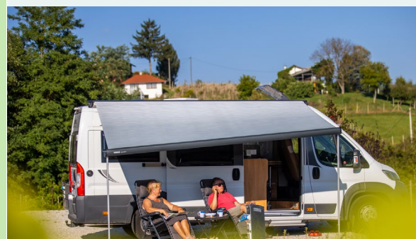
Par turistov, ki se sproščajo pred svojo prikolico v kampu

Nastanitev lahko rezervirate tudi prek družbenih medijev kmetije, aplikacij za takojšnje sporočanje (WhatsApp, Viber, Facebook Messenger) in tudi tako, da neposredno pokličete na njihovo telefonsko številko ali jim pošljete e-pošto.