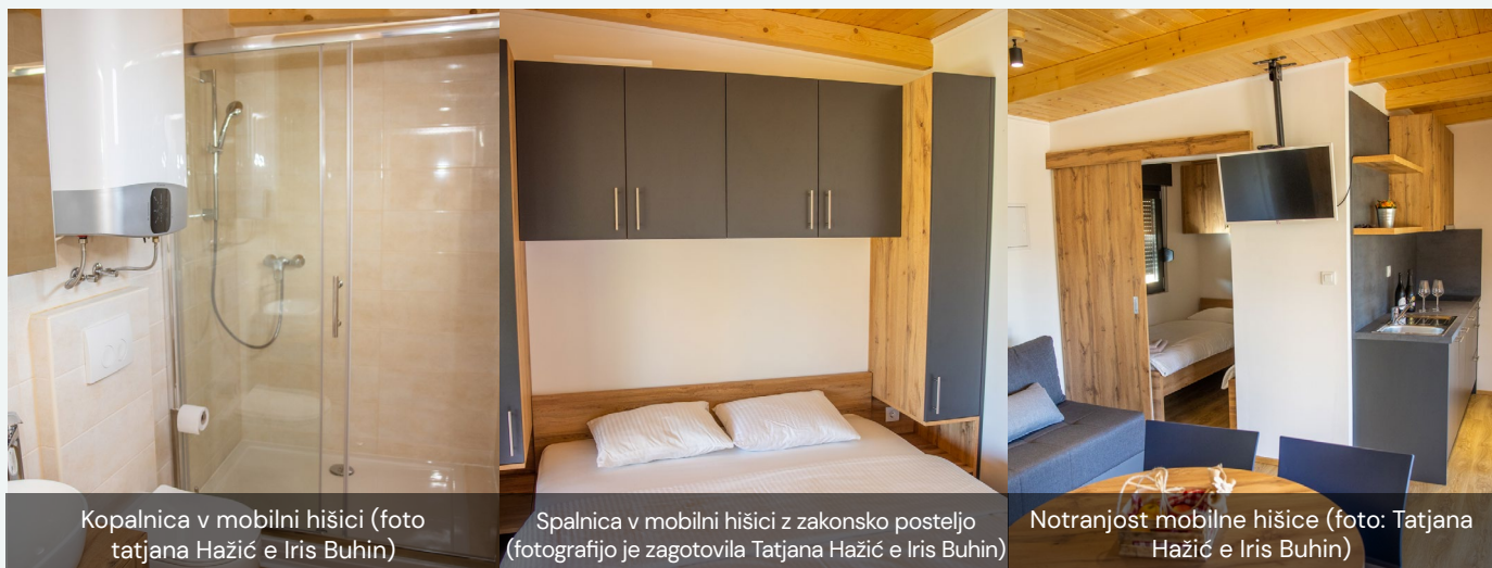
Kopalnica v mobilni hišici

Nekateri turisti prihajajo v organiziranih skupinah, med tistimi, ki so prišli to poletje, pa jih je nekaj že rezerviralo bivanje za prihodnje leto. Povprečni turist je star 45 let ali več.