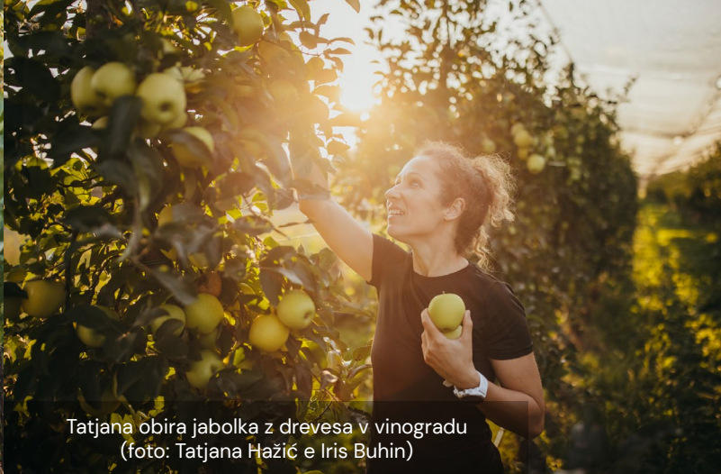
Tatjana obira jabolka z drevesa v vinogradu

Gostje lahko sodelujejo pri kmečkih opravilih, kot so obiranje jabolk in grozdja ali košnja trave. Na kmetiji za turiste organizirajo različne dogodke. Največ udeležencev pritegne mesečna tekaška dejavnost. Razdeljena je na tri različne kategorije (5 km, 10 km in 20 km) in ni tekmovalna, saj se vsa skupina na tek odpravi in vrne skupaj. Udeleženci tečejo čez hribe do reke Mure. Ob vrnitvi jih čakajo domače sladice, dobijo pa lahko tudi nekaj pijače.