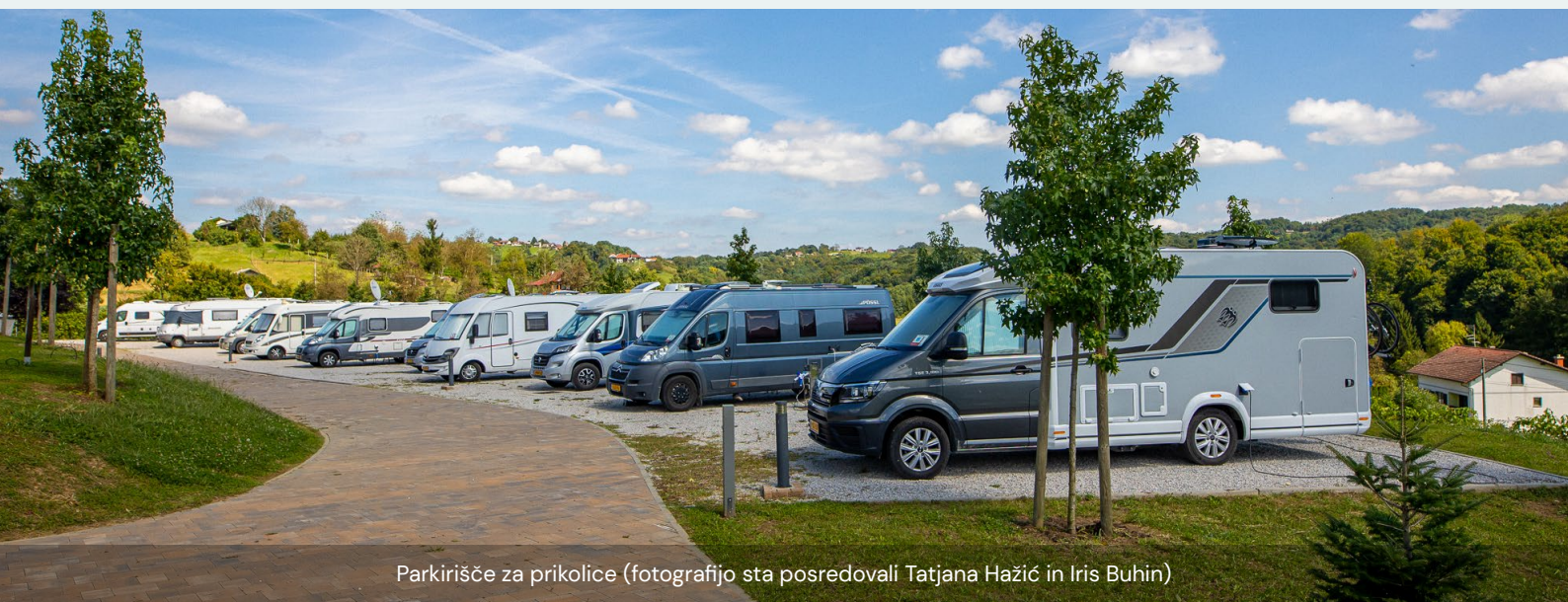
Parkirišče za prikolice