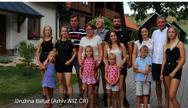
Družina Basař

Agroturizem se vrti predvsem okoli družinskega podjetja. Kmetija ne zaposluje zunanjih sodelavcev, vse naloge pa opravlja družina, ki jo sestavlja skupaj osem članov. Vsakemu članu so dodeljene posebne odgovornosti. Poleg tega sta se dva družinska člana v celoti posvetila agroturizmu in delata za polni delovni čas.