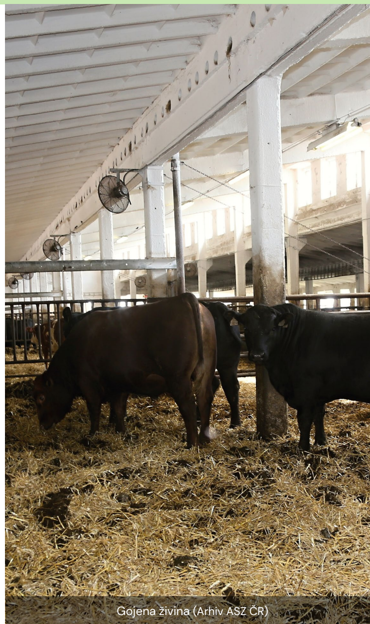
Gojena živina

Vendar so podjetniki priznali pomen finančne podpore. Izkoristili so subvencijo za določeno opremo, čeprav se je birokratski postopek, povezan s pridobitvijo subvencije, izkazal za veliko oviro. Premagovanje administrativnih ovir je lahko dolgotrajno in psihično naporno, kar je nepričakovano otežilo njihovo podjetniško pot.