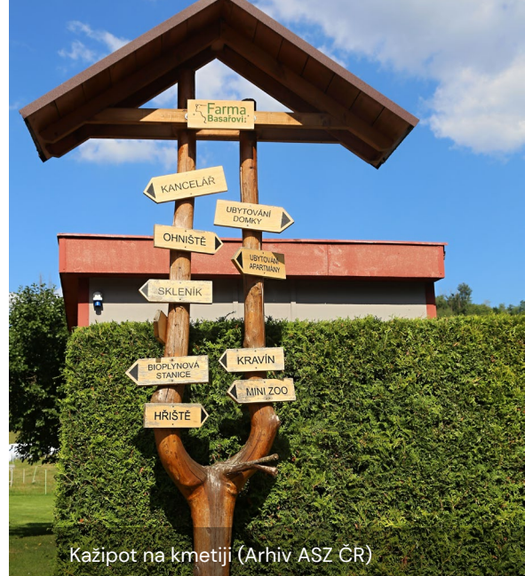
Kažipot na kmetiji

IG: https://www.instagram.com/farma_basarovi/