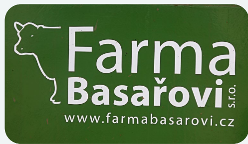
Logotip kmetije

Panoramski razgled ponuja 20 km oddaljeni razgledni stolp Žalý, s katerega se ponuja očarljiva razgledna točka. Ljubitelji adrenalina se lahko odpravijo v 20 km oddaljene Janské lázně in prehodijo razburljivo Pot vrhov dreves. Med raznolikimi znamenitostmi na doseg roke so jez Les Reigns, živalski vrt Dvůr Králové, Špindlerjev mlin, Trutnov, Černý důl, bolnišnica Kuks in razgledni stolp Zvičina, od katerih ima vsaka edinstven pridih v turistični tapiseriji regije.