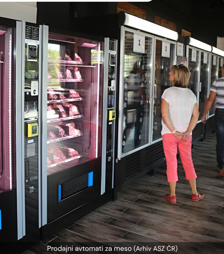
Prodajni avtomati za meso

Kljub temu da podjetnika nista imela izkušenj na področju turizma ali podjetništva, sta se z