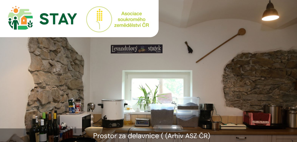
Prostor za delavnice