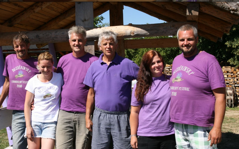
Družina Drlík

Zanimivo je, da se je podjetnik odločil za agroturistični podvig, ne da bi poiskal zunanjo pomoč ali nasvet. Pri ustanovitvi kmečkega turizma niso bili uporabljeni prispevki, mentorstvo, financiranje ali donacije materiala.