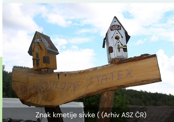
Znak kmetije sivke

Medtem ko so spletne platforme, zlasti spletna mesta, osrednjega pomena za strategijo komercializacije, večina komunikacije s strankami poteka prek elektronske pošte ali mobilnega telefona. Ta komunikacija je vsestransko orodje, ki omogoča prilagojeno interakcijo, obravnavanje posebnih poizvedb in zagotavljanje podrobnih informacij o rezervaciji.