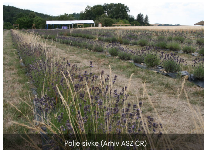
Polje sivke

Še ena stalna ovira, ki jo je izpostavil lastnik, so napeti odnosi s sosedom, ki se pritožuje nad presežkom avtomobilov na tem območju. To vprašanje ne vpliva samo na trenutno izvajanje poslovanja, temveč tudi na ohranjanje pozitivnih sosedskih odnosov. Usklajevanje potreb podjetja z vidiki skupnosti je pogost izziv v kmečkem turizmu, kjer je lahko dotok obiskovalcev včasih v nasprotju s pričakovanji lokalnih prebivalcev.