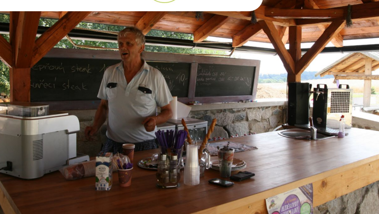
Bar sivke na polju