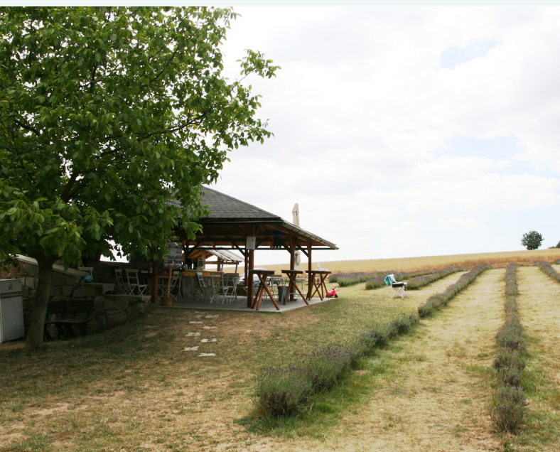
Bar sivke na polju

V prihodnje družina, ki vodi kmetijo sivke, verjetno pričakuje nadaljnjo rast njihovega kmetijskega turizma. Morda bodo poskušali razširiti svojo ponudbo, izboljšati infrastrukturo za gostovanje dogodkov in raziskati nove tržne poti. Poleg tega lahko družina daje prednost trajnosti in okoljskim praksam, v skladu z naraščajočim zanimanjem turistov za okolju prijazna in pristna doživetja.