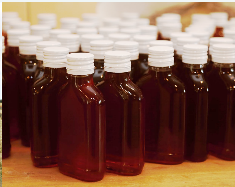
Sivkin sirup