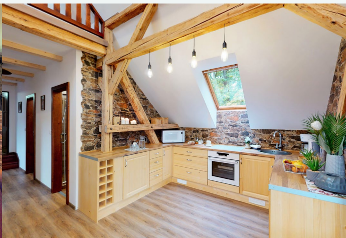
Notranjost apartmaja: dnevna soba in kuhinja