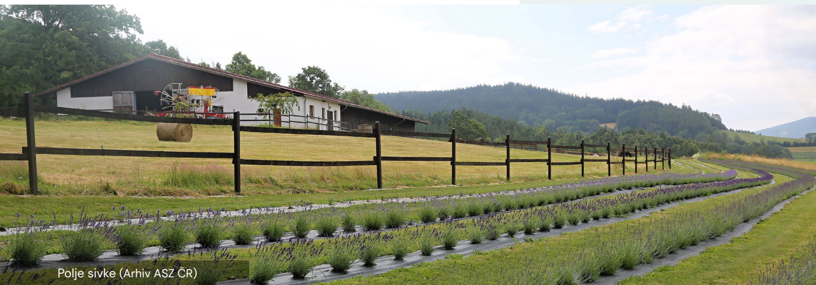
Polje sivke

3. Komunikacija. Ta oblika komunikacije omogoča učinkovite rezervacije in zagotavlja, da so potencialni gostje dobro obveščeni in postreženi.