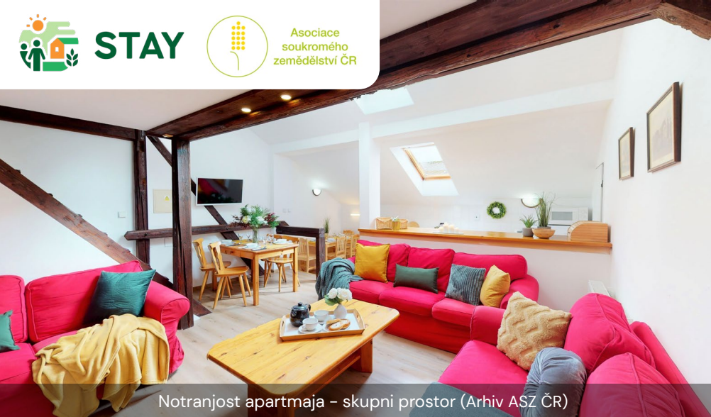
Notranjost apartmaja – skupni prostor