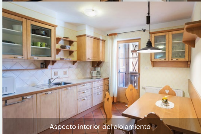
Aspecto interior del alojamiento