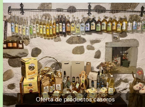
Oferta de productos caseros

El sistema central de reservas está gestionado únicamente por el propietario y su esposa.