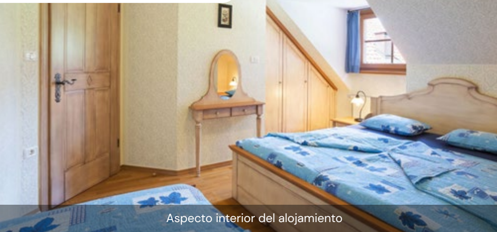
Aspecto interior del alojamiento