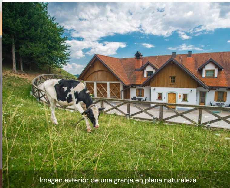
Imagen exterior de una granja en plena naturaleza