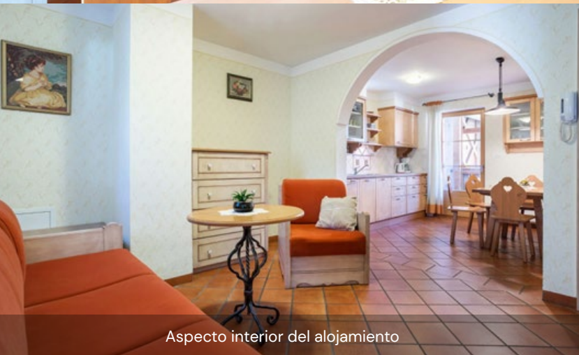
Aspecto interior del alojamiento