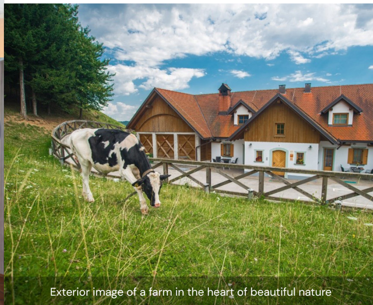
Exterior image of a farm in the heart of beautiful nature