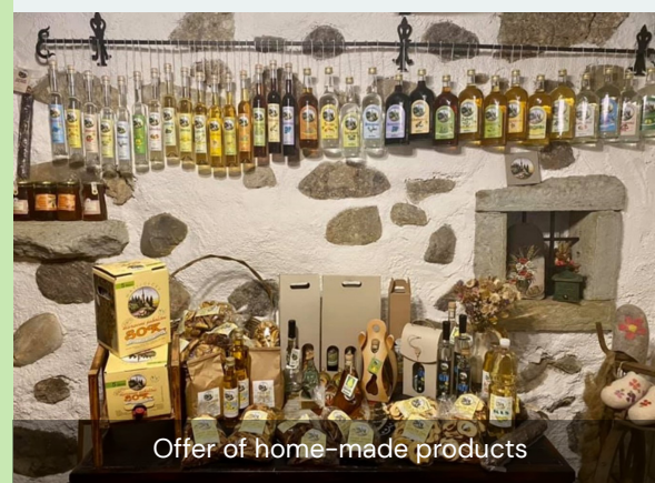
Offer of home-made products

Centrální rezervační systém spravuje pouze majitel a jeho manželka.