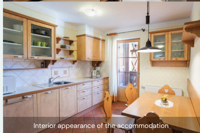
Interior appearance of the accommodation