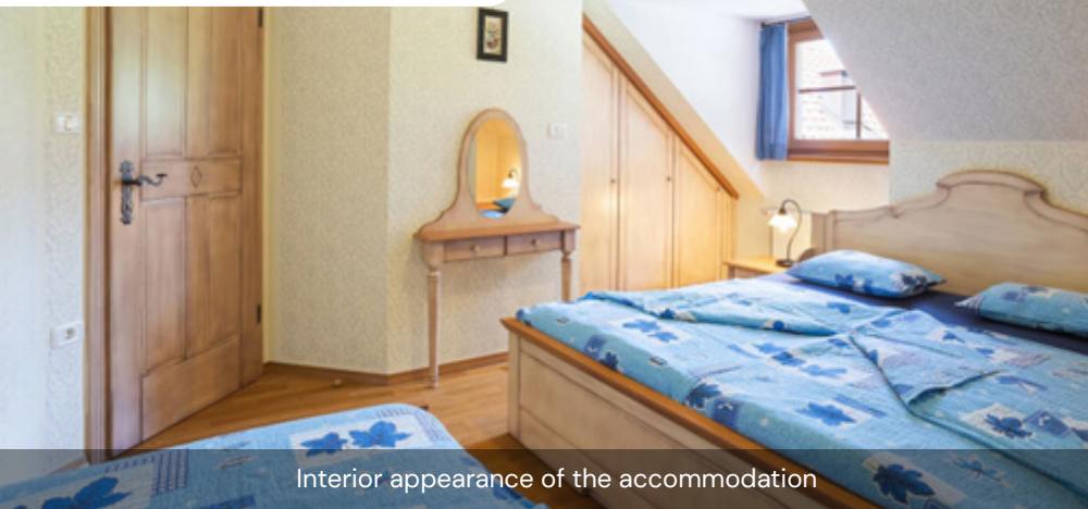
Interior appearance of the accommodation