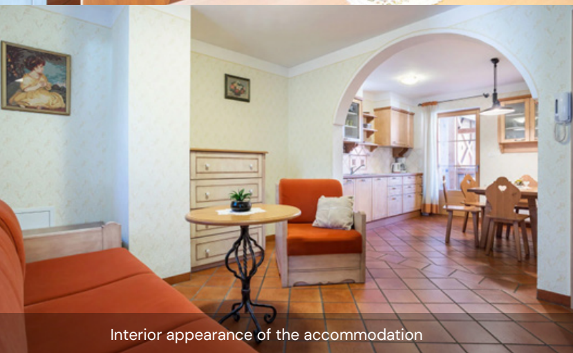
Interior appearance of the accommodation