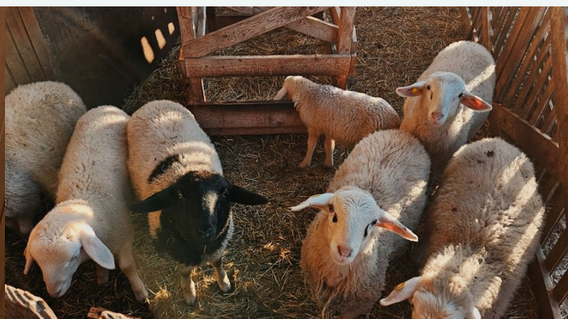
Se trata de una explotación ganadera, en la que predomina la cría de ovejas.