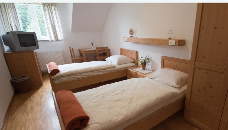
Una foto de uno de sus alojamientos, donde predominan la hogareñidad y los materiales naturales.

Por lo general, los turistas no participan en el trabajo de la granja. Sin embargo, participan en la creación del jardín de hierbas y en las presentaciones y visitas guiadas a la granja.