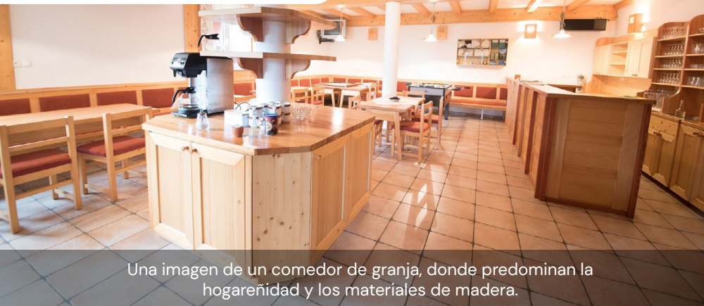
Una imagen de un comedor de granja, donde predominan la hogareñidad y los materiales de madera.