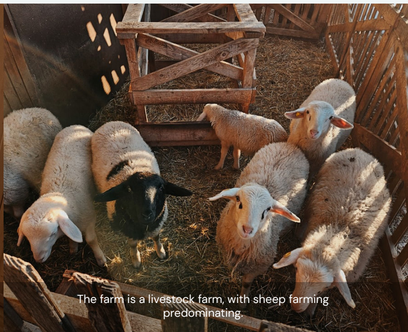
The farm is a livestock farm, with sheep farming predominating.