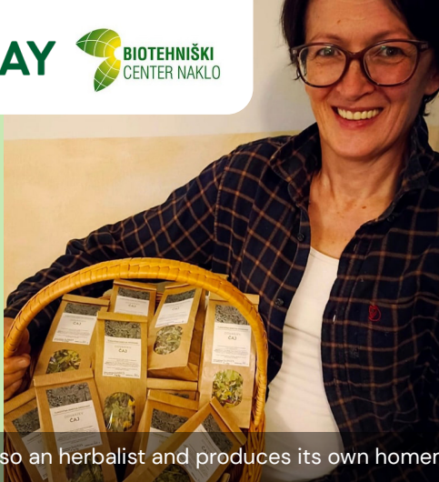
The farm is also an herbalist and produces its own homemade teas.