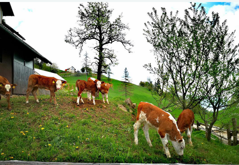
Cattle are also kept on the farm

Na podzim a na jaře mají také více práce s hospodářskými zvířaty, v létě svá zvířata ustájují na Krvavci.