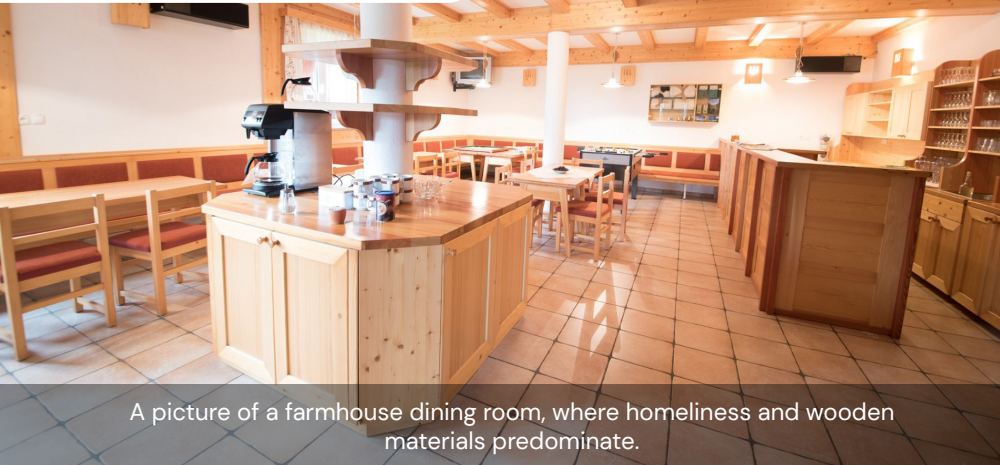
A picture of a farmhouse dining room, where homeliness and wooden materials predominate.