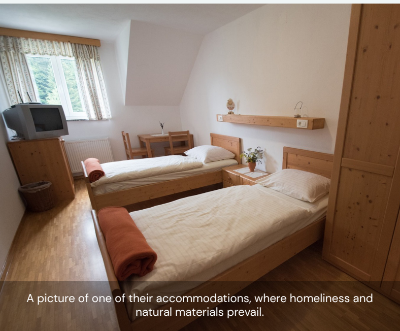
A picture of one of their accommodations, where homeliness and natural materials prevail.

Turisté se zpravidla neúčastní zemědělských prací. Účastní se však tvorby bylinkové zahrady a prezentací a prohlídek farmy.