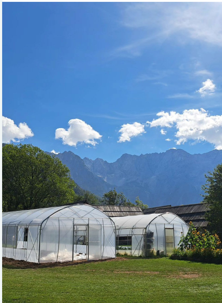
La granja cultiva alimentos durante todo el año en su propio invernadero.

Nuestras expectativas para el futuro son muy positivas, dada nuestra situación y rendimiento actuales.