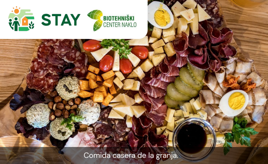
Comida casera de la granja.