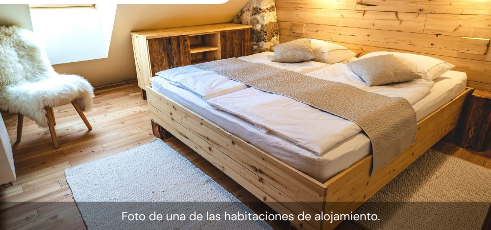
Foto de una de las habitaciones de alojamiento.