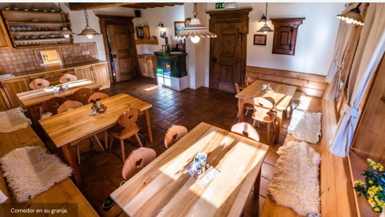
Comedor en su granja.

No implican a los turistas en su trabajo en la granja, ya que esto supondría un trabajo extra para ellos.