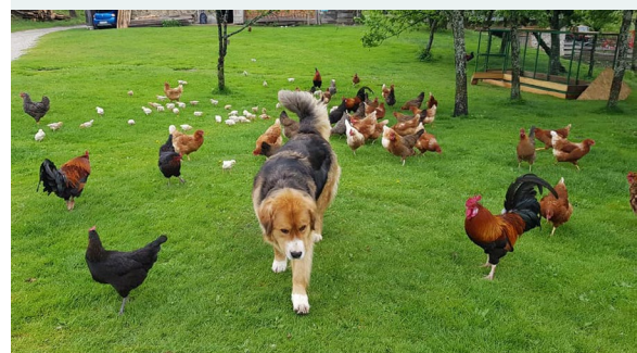
Animales en su granja.

A lo largo de los años, la granja Šenk ha alojado a más turistas nacionales, pero últimamente su alcance se ha extendido a los extranjeros, que son especialmente aficionados a sus ofertas de acampada. Su ocupación varía según la temporada. Los turistas nacionales suelen visitarlo mucho más en los meses de invierno y menos en los meses de temporada alta de verano, mientras que los extranjeros lo hacen sobre todo en julio y agosto.