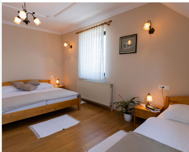
Foto de una de las habitaciones de alojamiento.

En un futuro próximo, quieren completar su objetivo de transformar su negocio y empezar a operar al nivel que se han fijado. En el ámbito agrícola, quieren aumentar los volúmenes de producción mediante licitaciones y, si es necesario, crear instalaciones de transformación a mayor escala.