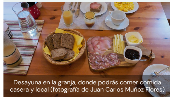
Desayuna en la granja, donde podrás comer comida casera y local

El jefe de la granja expresó su preocupación por la comercialización de sus productos y ofertas, ya que hay mucha competencia en el mercado y sin una comercialización adecuada es muy poco probable que sobrevivan.