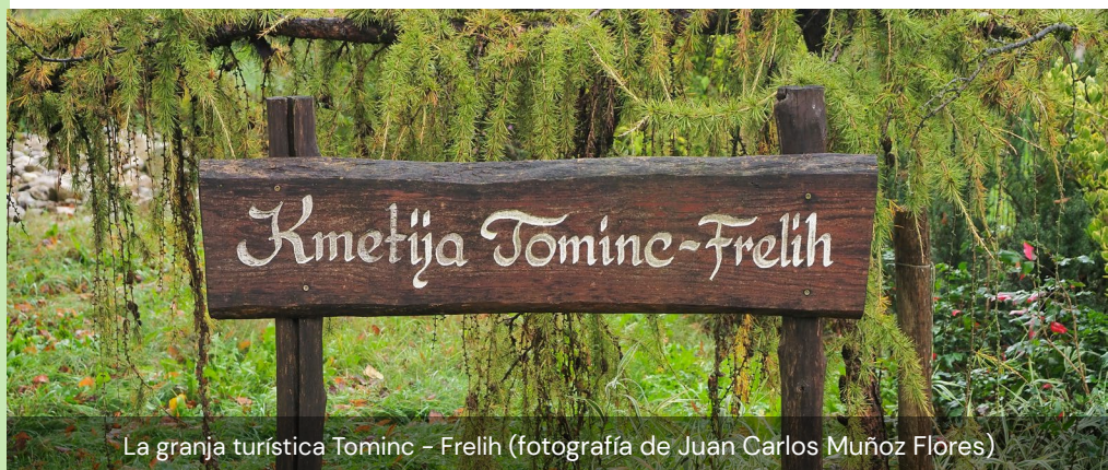
La granja turística Tominc – Frelih