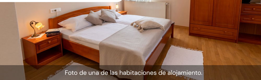
Foto de una de las habitaciones de alojamiento.