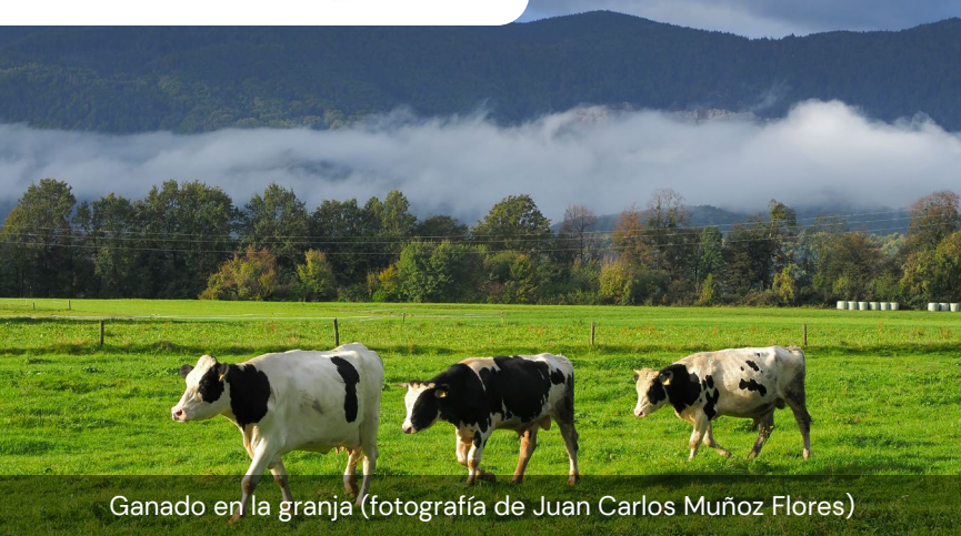
Ganado en la granja