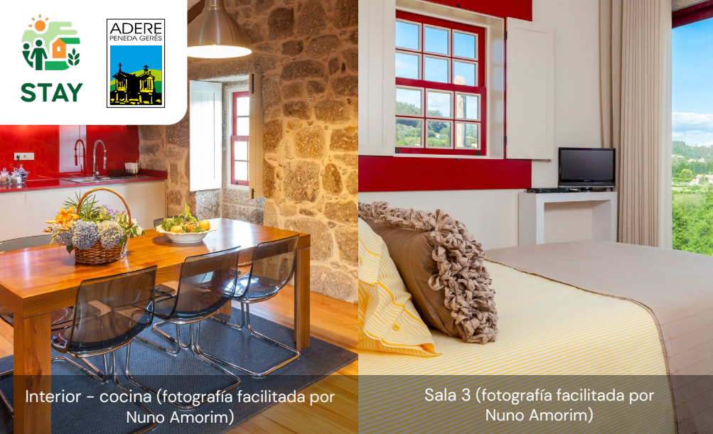
Interior – cocina