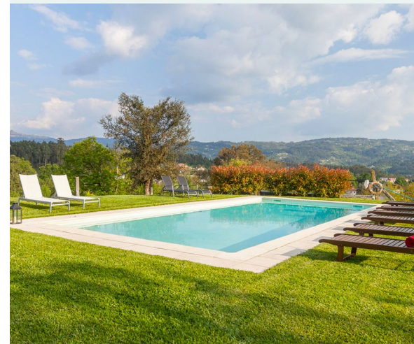
Zona de la piscina

Instagram https://www.instagram.com/quinta_do_olival/