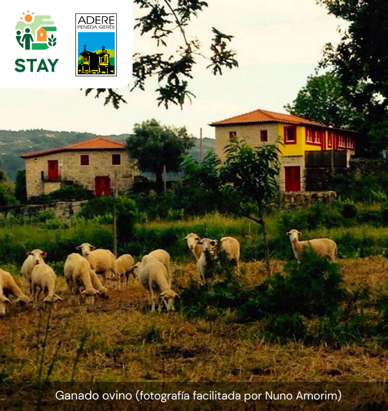
Ganado ovino