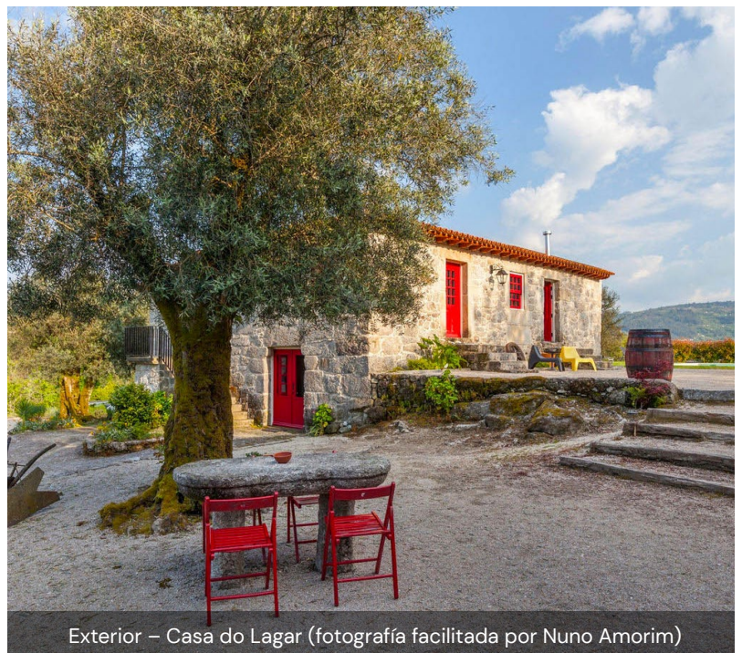
Exterior – Casa do Lagar

La Quinta do Olival está situada en el municipio de Arcos de Valdevez, en el corazón de la región del Alto Minho. Esta región, con sus bellos paisajes naturales y pastorales, sus verdes colinas surcadas por aguas cristalinas, una gastronomía rica y variada y el vinho verde de la región son privilegios de los que pueden disfrutar los visitantes. En el territorio también se puede practicar senderismo, ciclismo y actividades acuáticas como rafting y barranquismo.