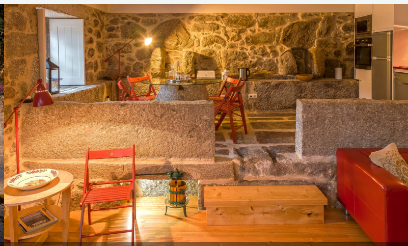
Interior - Casa do Lagar