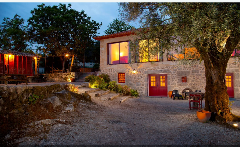
Exterior - noche

Se ofrece a los huéspedes la posibilidad de disfrutar de los frutos de los huertos y del paisaje pausado de la región del Alto Minho. Los huéspedes también pueden acompañar en los trabajos de la granja, como cuidar el huerto ecológico, recoger arándanos o vendimiar.