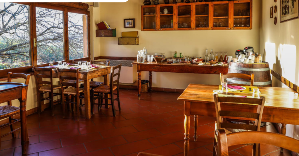
Bio Agriturismo Breakfast buffet