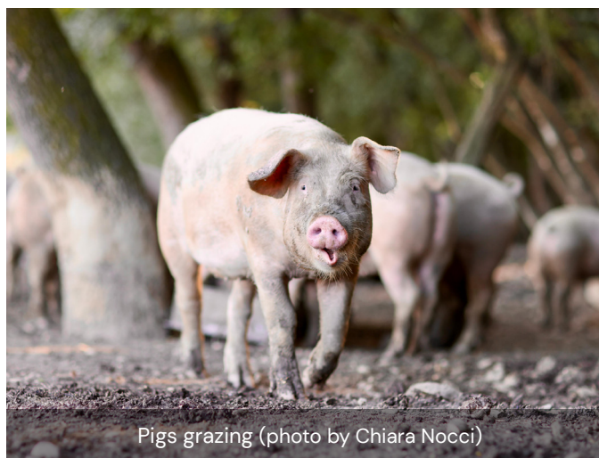
Pigs grazing

Su oltre 40 ettari, vengono coltivati cereali e legumi antichi attraverso l'antico sistema delle rotazioni. Questa tecnica permette alle mucche di pascolare ogni stagione su pascoli diversi, fertilizzando i campi e mantenendoli puliti dai semi delle erbacce. L'allevamento comprende bovini e suini.