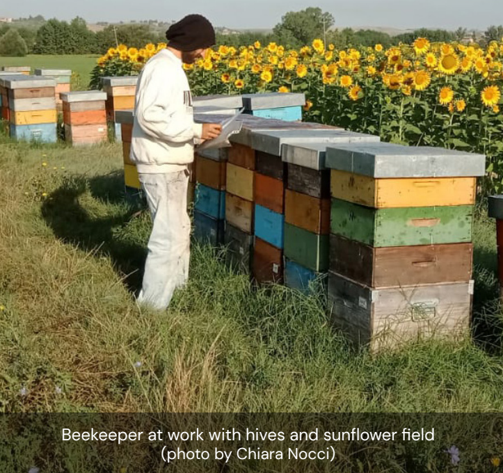
Beekeeper at work with hives and sunflower field

L'attività agrituristica è nata e cresciuta grazie al lavoro di persone che, senza ricorrere ad aiuti o supporti esterni, hanno seguito un'idea e capito che poteva essere un'opportunità per il futuro dell'azienda agricola.