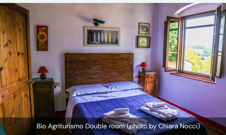
Bio Agriturismo Double room

Ristoro, ricavato nell'antico fienile della fattoria, dove è possibile fare pranzi, cene e degustazioni e godere di una vista superlativa sulle colline del Chianti. I prodotti offerti al Bio Ristoro sono di produzione aziendale e locale e seguono la stagionalità. Tra le attività offerte agli ospiti c'è un tour guidato della fattoria, delle coltivazioni e della cantina, durante il quale viene spiegata la filosofia dell'azienda e tutte le attività svolte. Gli ospiti possono anche partecipare all'apicoltura insieme a esperti apicoltori. Su prenotazione, è possibile partecipare a corsi di cucina presso il Bio Ristoro. Per arricchire l'offerta dedicata agli ospiti, l'agriturismo collabora con fisioterapisti e massaggiatori che offrono il servizio direttamente presso l'agriturismo. Collabora inoltre con tour operator che offrono tour in bicicletta e con aziende che noleggiavano biciclette per un semplice noleggio. Gli ospiti non partecipano direttamente all'attività agricola, ma possono assistere in alcune operazioni come la cura delle api. L'affluenza annuale è di circa 1450 persone all'anno, distribuite un po' in tutto il periodo di apertura.