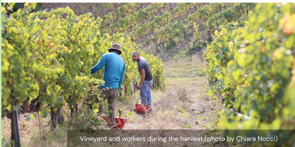
Vineyard and workers during the harvest

Il Bio Agriturismo La Ginestra si trova in Toscana nel Comune di San Casciano Val di Pesa, in provincia di Firenze. Il territorio è prevalentemente collinare e si trova nell'area geografica del Chianti caratterizzata dalla coltivazione della vite e conosciuta in tutto il mondo per i suoi paesaggi e la produzione di vino. L'azienda si estende per circa 100 ettari, di cui 40 HA coltivati a cereali e legumi, 6 HA di vigneti e 2 HA di oliveti. La maggior parte dei terreni si trova nella zona collinare dove si trova anche la casa colonica, mentre alcune coltivazioni si trovano nella valle vicino al corso del fiume Pesa. Non lontano dalla strada principale che collega Firenze a Siena, la sua posizione è particolarmente strategica per raggiungere numerose mete turistiche di diverso interesse. Non lontano dalle città d'arte, a 30 km da Firenze e a 40 km da Siena, è immerso nella zona del Chianti, che di per sé è una meta turistica molto ambita e rinomata.