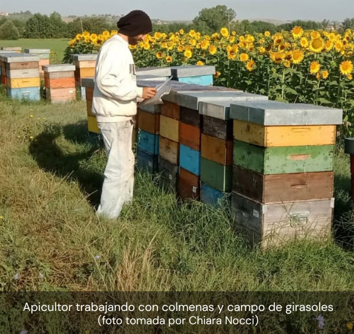
Apicultor trabajando con colmenas y campo de girasoles

Su formación se centraba más en la agricultura y la agronomía técnica.