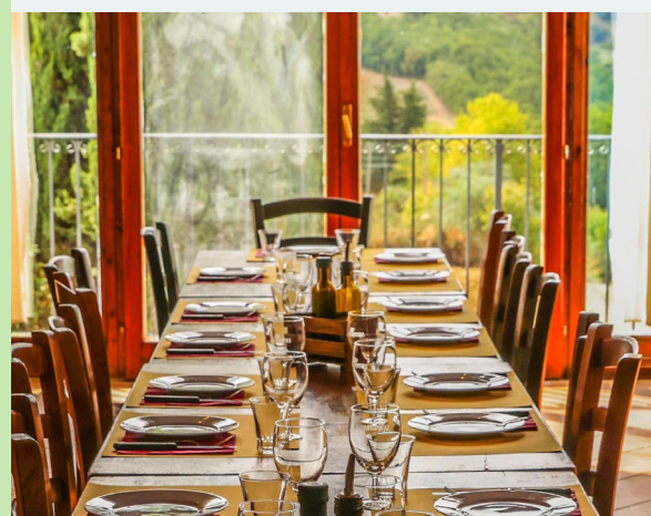
Comedor de Agroturismo Bio

Además, la granja está presente en el portal específico de agroturismo Agriturismo.it https://www.agriturismo.it/it/agriturismi/toscana/firenze/Bio-AgriturismoLaGinestra-4900176/index.html en Expedia https://www.expedia.it/San-Casciano-In-Val-Di-Pesa-Hotel-Bio-Agriturismo-La-Ginestra.h27484540.Informazioni-Hotel y en Airbnb https://www.airbnb.it/ .