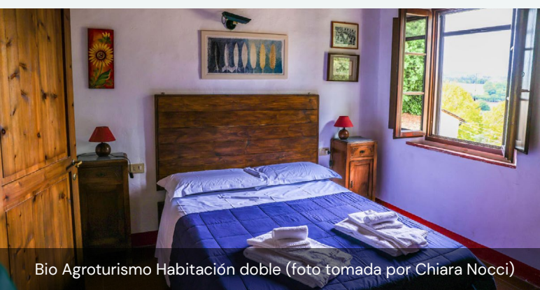
Bio Agriturismo Habitación doble

por las producciones naturales y, en particular, por el vino natural. La oferta consiste en pernотaciones con desayuno incluido. Existe un Bio Ristoro, creado en el antiguo granero de la masía, donde es posible celebrar comidas, cenas y degustaciones, así como disfrutar de una vista superlativa de las colinas del Chianti. Los productos que se ofrecen en el Bio Ristoro son de granja y de producción local y siguen la estacionalidad. Entre las actividades que se ofrecen a los huéspedes está una visita guiada a la granja, los cultivos y la bodega, durante la cual se explica la filosofía de la granja y todas las actividades que se llevan a cabo. Los huéspedes también pueden participar en la apicultura junto a apicultores expertos. Es posible, previa reserva, recibir clases de cocina en el Bio Ristoro. Para enriquecer la oferta dedicada a los huéspedes, el agroturismo colabora con fisioterapeutas y masajistas que ofrecen el servicio directamente en el agroturismo. También colabora con operadores turísticos que ofrecen excursiones en bicicleta y con empresas que alquilan bicicletas de alquiler sencillo. Los huéspedes no participan directamente en la agricultura, pero pueden ayudar en ciertas operaciones, como el cuidado de las abejas. La asistencia anual es de unos 1.450 al año, repartidos un poco a lo largo del periodo de apertura.