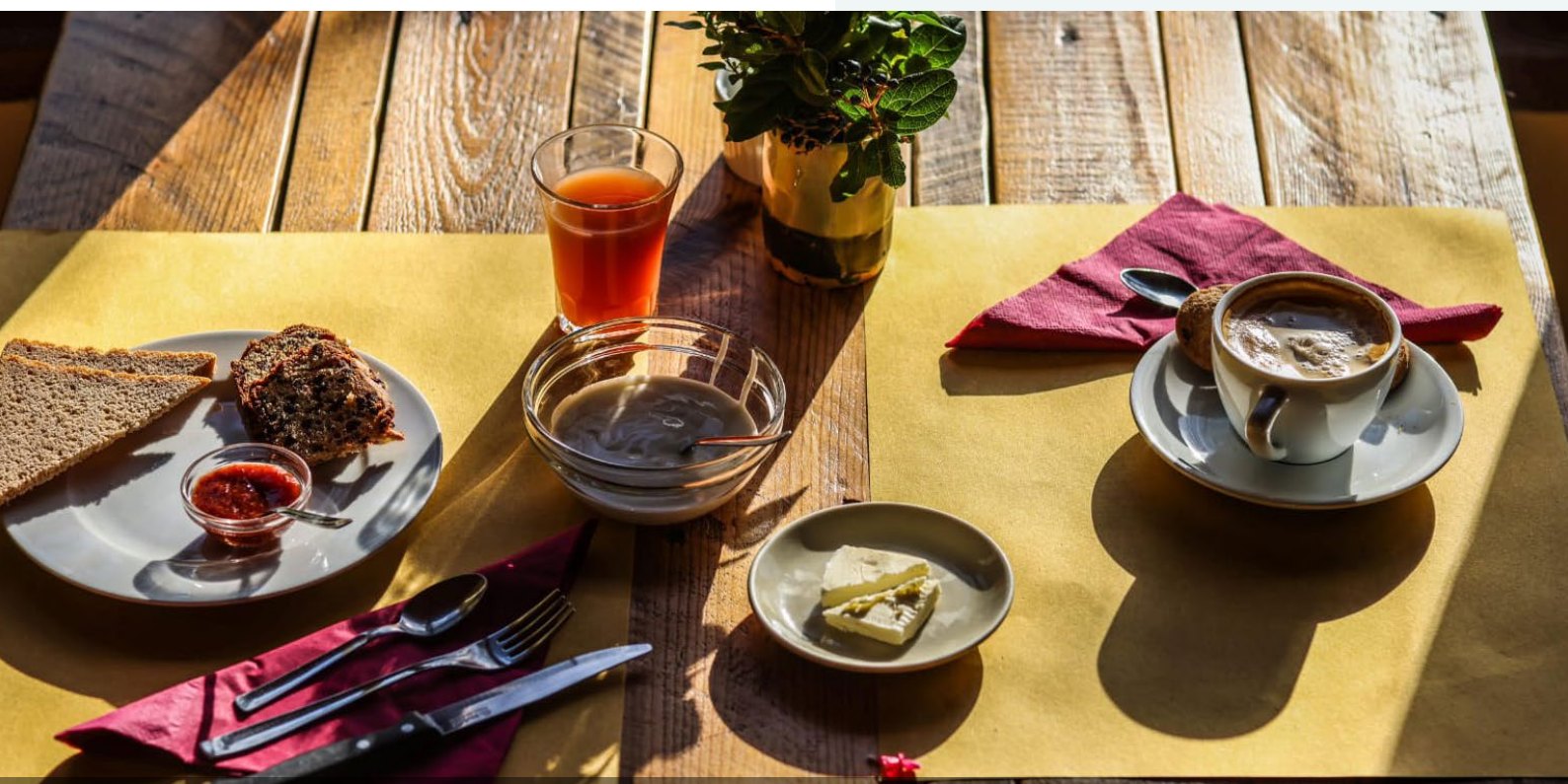
Mesa de desayuno Bio Ristoro

La expectativa para el futuro es crecer, mejorar y confirmar lo conseguido en los últimos años y comprometerse con el negocio para continuarlo de la mejor manera posible.