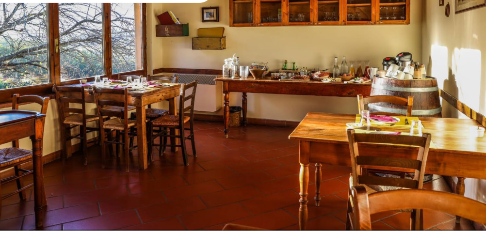
Bio Ristoro Desayuno buffet