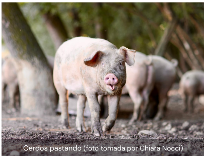
Cerdos pastando

Esta técnica permite que las vacas pasten cada temporada en pastos diferentes, fertilizando los campos y manteniéndolos limpios de semillas de malas hierbas. La agricultura incluye ganado vacuno y porcino.