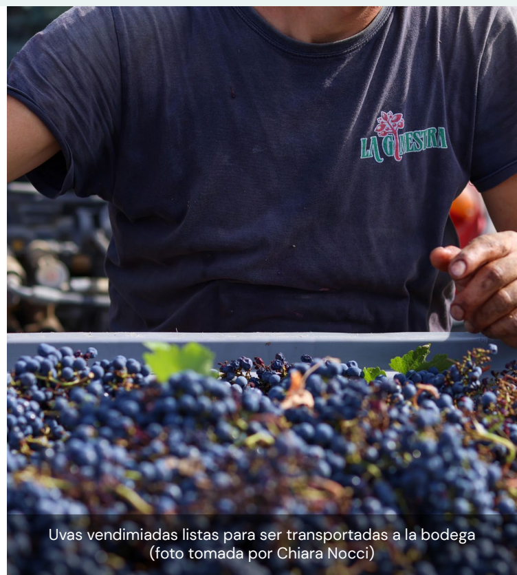
Uvas vendimiadas listas para ser transportadas a la bodega

En más de 40 hectáreas se cultivan cereales y leguminosas ancestrales mediante el antiguo sistema de rotaciones.