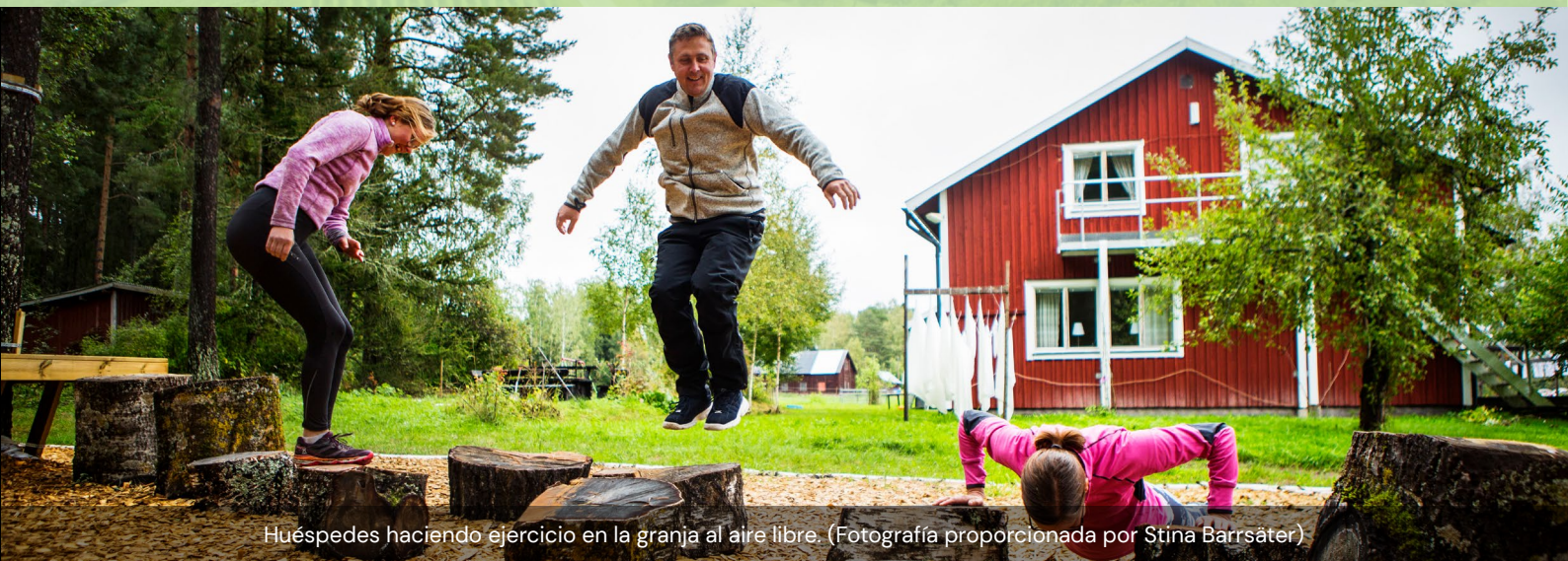
Huéspedes haciendo ejercicio en la granja al aire libre.

Otro consejo podría ser: mira lo que tienes y lo que puedes hacer con ello. El camino está hecho de pequeños pasos. Puedes empezar abriendo tu granja al público una vez al año y desarrollar gradualmente tu negocio. Utiliza sabiamente los recursos que tienes, porque a veces no conocemos el potencial económico del que ya disponemos”.