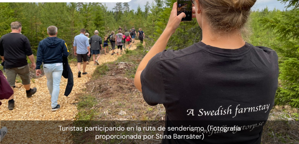
Turistas participando en la ruta de senderismo.