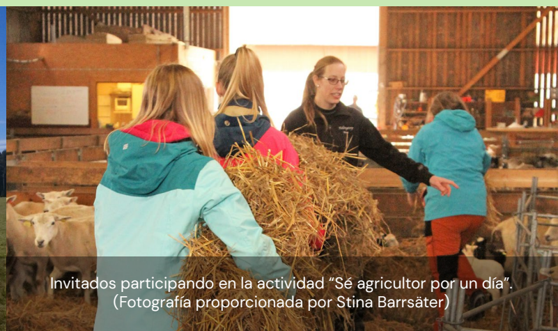
Invitados participando en la actividad "Sé agricultor por un día".