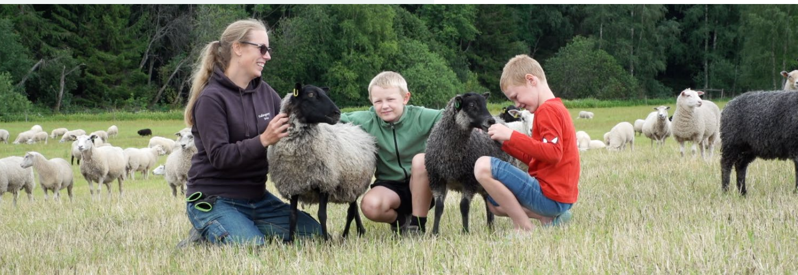
Niños abrazando ovejas en las tierras de la granja.