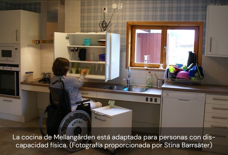
La cocina de Mellangården está adaptada para personas con discapacidad física.