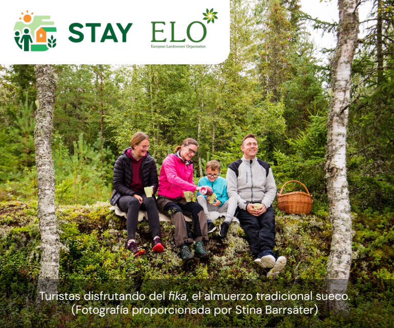
Turistas disfrutando del fika , el almuerzo tradicional sueco.