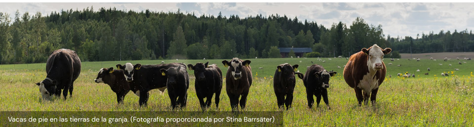
Vacas de pie en las tierras de la granja.

El otro gran reto al que se enfrentaron fue la creación de una empresa independiente de la granja que se ocupara exclusivamente del alojamiento que ofrecen a los turistas. De hecho, los requisitos legales, incluido el tratamiento fiscal, que se aplican a los sectores agrícola y turístico son diferentes. Por eso, aunque las dos empresas se gestionan conjuntamente, cada una tiene su propio régimen jurídico. Por esta misma razón, la familia posee otra empresa dedicada exclusivamente a la venta de la carne que producen a partir de su ganado.