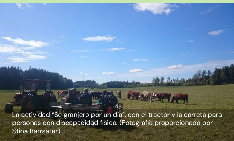
La actividad "Sé granjero por un día", con el tractor y la carreta para personas con discapacidad física.

La granja tiene una tienda donde se vende la carne que producen de sus animales. Para ello, colaboran con otros productores, que les ayudan a procesar su carne y a elaborar productos como hamburguesas o salchichas. También venden lana y grano a empresas más grandes.