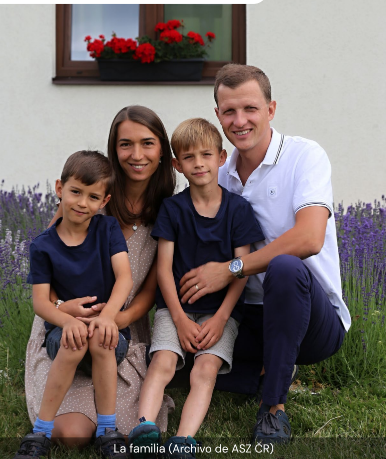
La familia