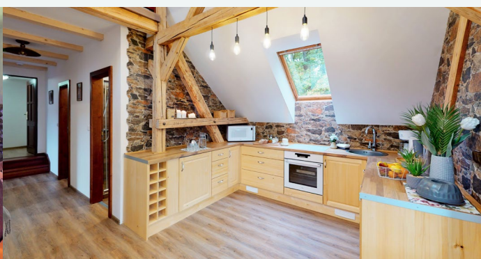
Interior del apartamento – Salón y cocina