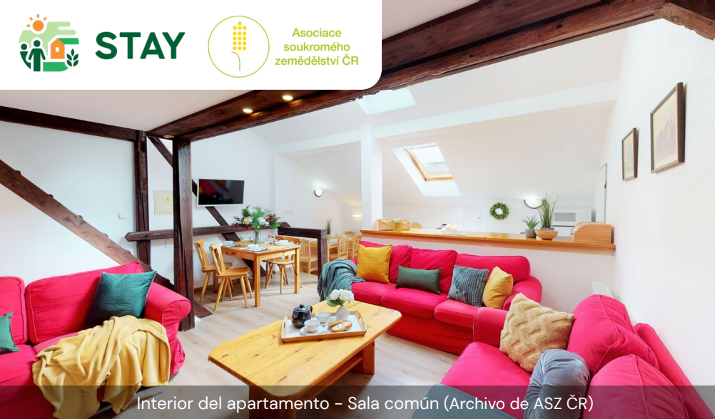
Interior del apartamento – Sala común