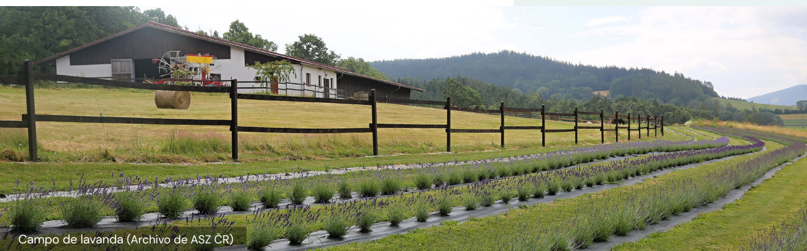
Campo de lavanda

Sin embargo, el elemento de marketing más obvio para la Pensión U Sebastiana son las opiniones y recomendaciones de los huéspedes. Esta forma de opinión desempeña un papel clave en la mejora de la calidad del servicio y la credibilidad del negocio.