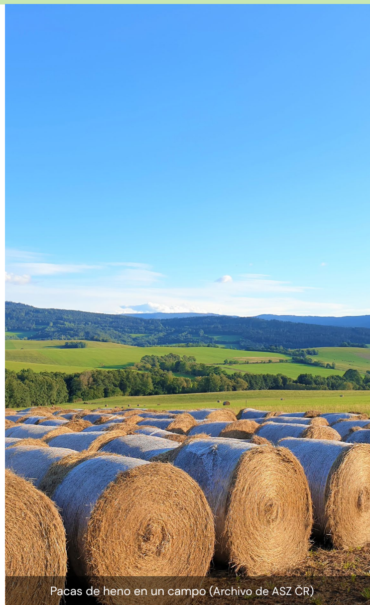
Pacas de heno en un campo

Aunque Lucie y Radomil Hrabět no tenían experiencia previa en el sector turístico antes de poner en marcha su negocio de agroturismo, su determinación, cuidadosa reconstrucción y atención a la mejora de la calidad del servicio contribuyeron al éxito de la Pensión U Sebastiana.